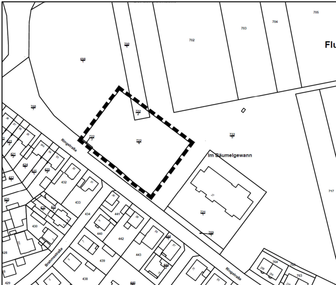
Abb. 1: Lage des Plangebiets „Ärztehaus Gleisdreieck“ in Lampertheim (He).

Das Plangebiet gehört zum Naturraum 222 „Nördliche Oberrheinniederung“ und zur Untereinheit 222.1 „Mannheim-Oppenheimer Rheinniederung“. Einen Schutzstatus (Natura 2000 oder Naturschutzgebiet) gibt es nicht.