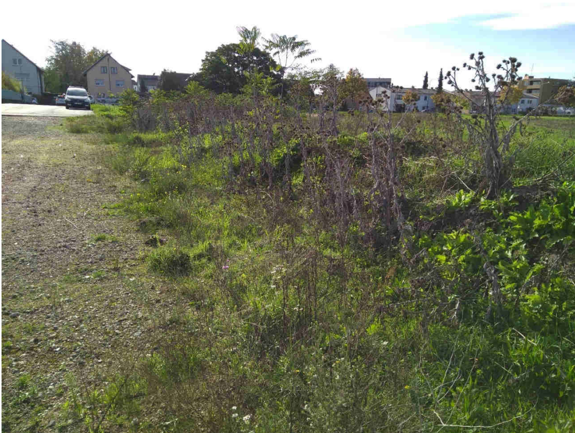
Abb. 8: Besonnte Randstrukturen bieten ein Potential für Eidechsen.