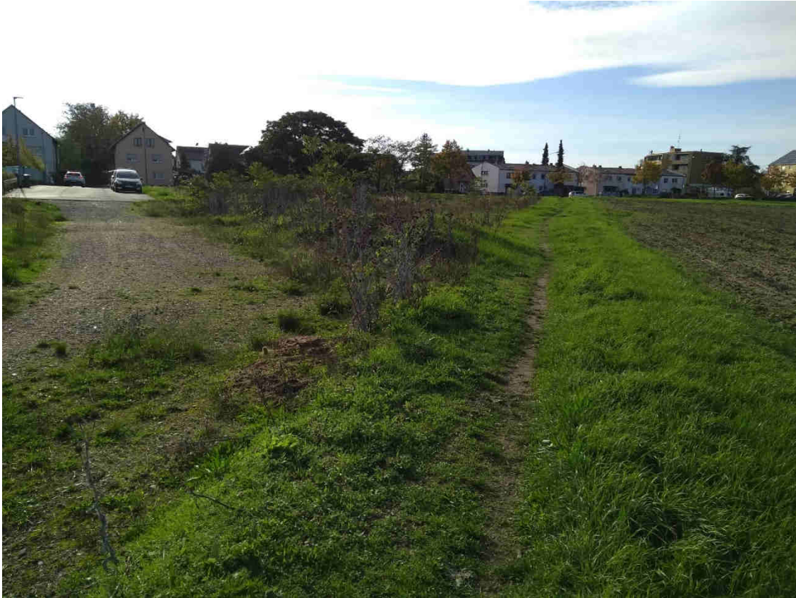
Abb. 9: Blick über das Plangebiet nach Süden zur Ringstraße.