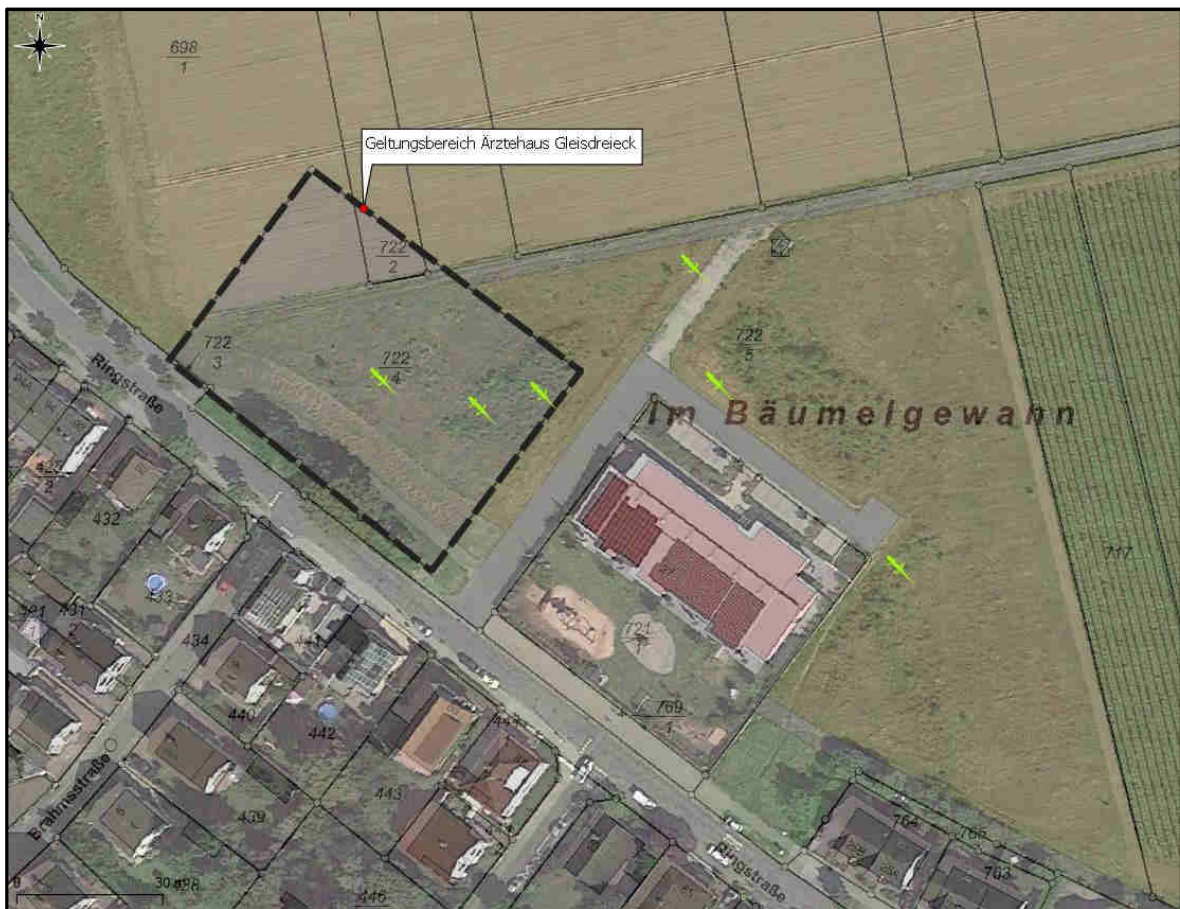
Abb. 2: Verteilung der Zauneidechsenfunde im Plangebiet und dessen Umgebung.