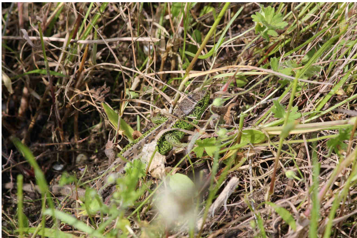
Abb. 10: Männliche Zauneidechse im Altgrasbestand des Plangebiets (Abb. 8).