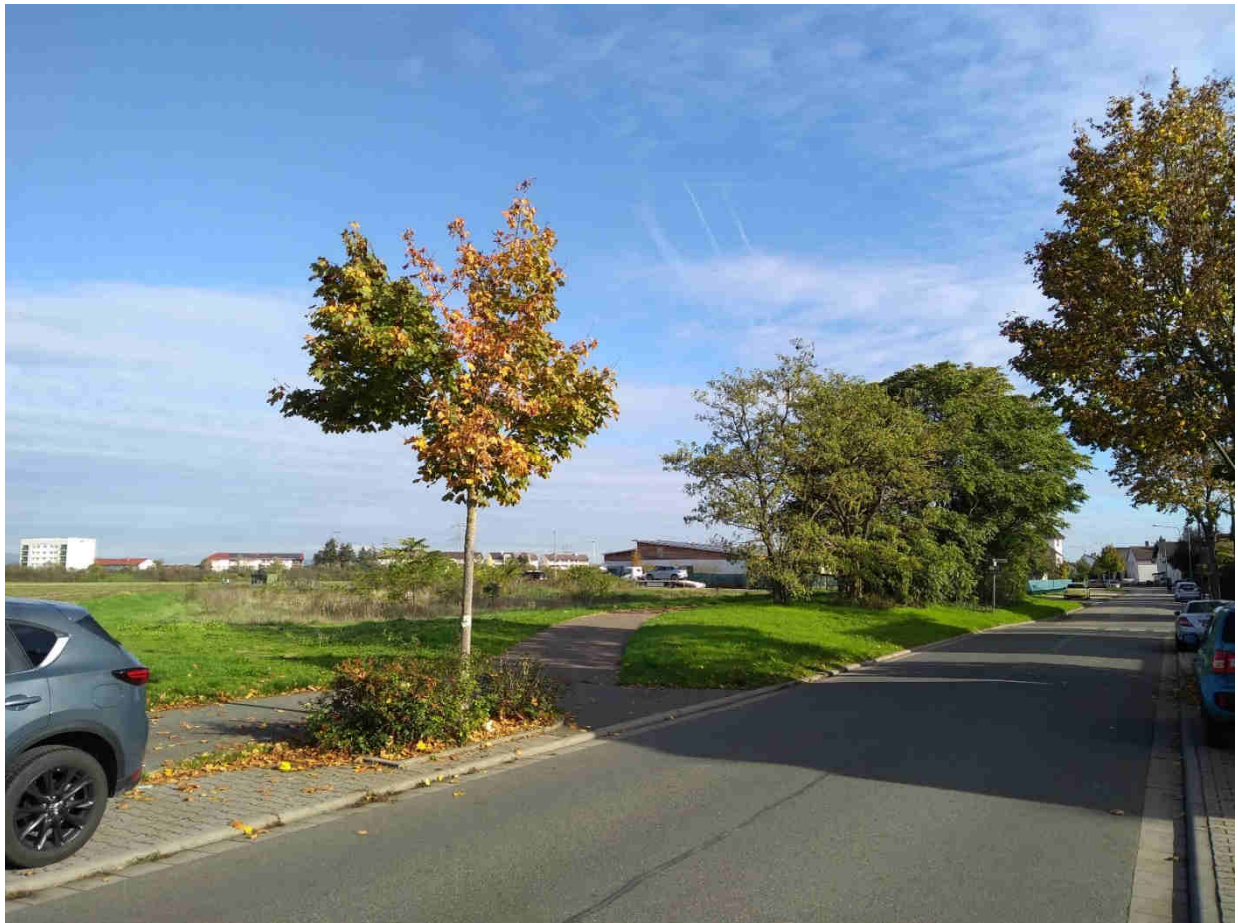
Abb. 6: Blick von der Ringstraße auf das Plangebiet Richtung Osten.