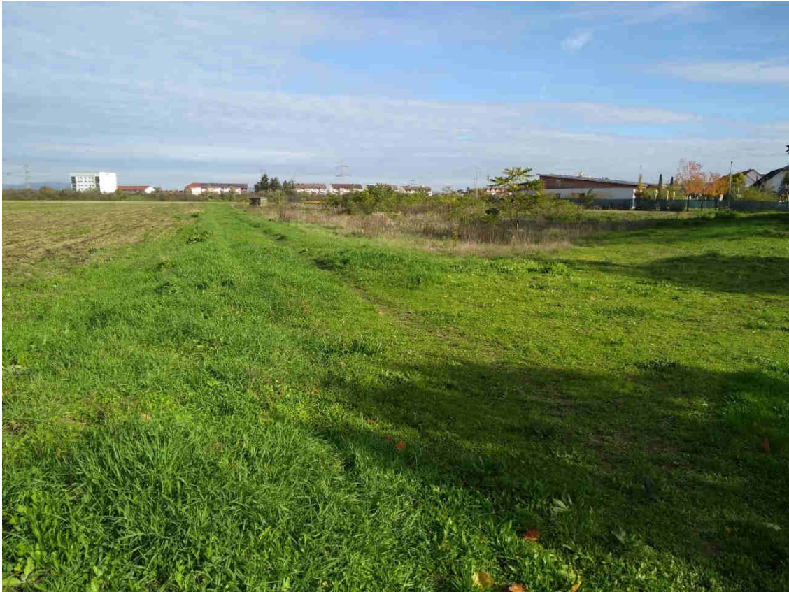
Abb. 7: Plangebiet mit Grünland- und Ackeranteil.