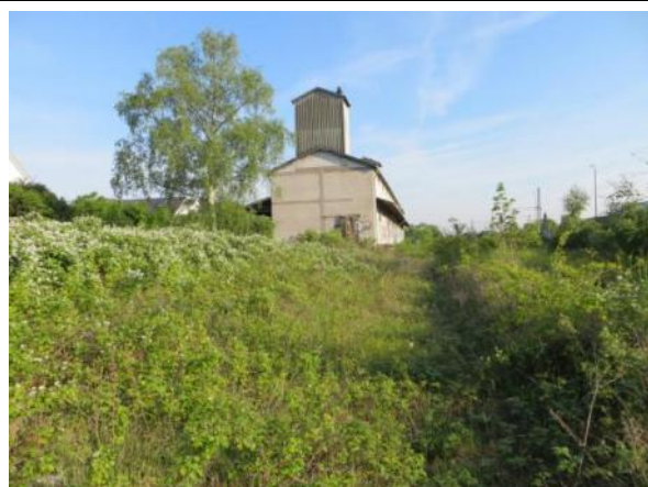
Abb. 2a: Gebüchssukzession mit artenarmem Brombeerbestand 2014.

Empfindlich gegenüber: Schadstoffeinträgen, Veränderungen des Wasserhaushaltes