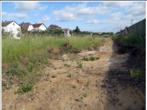
Abb. 6 a: Schotterflächen entlang der ehemaligen Gleise 2014.