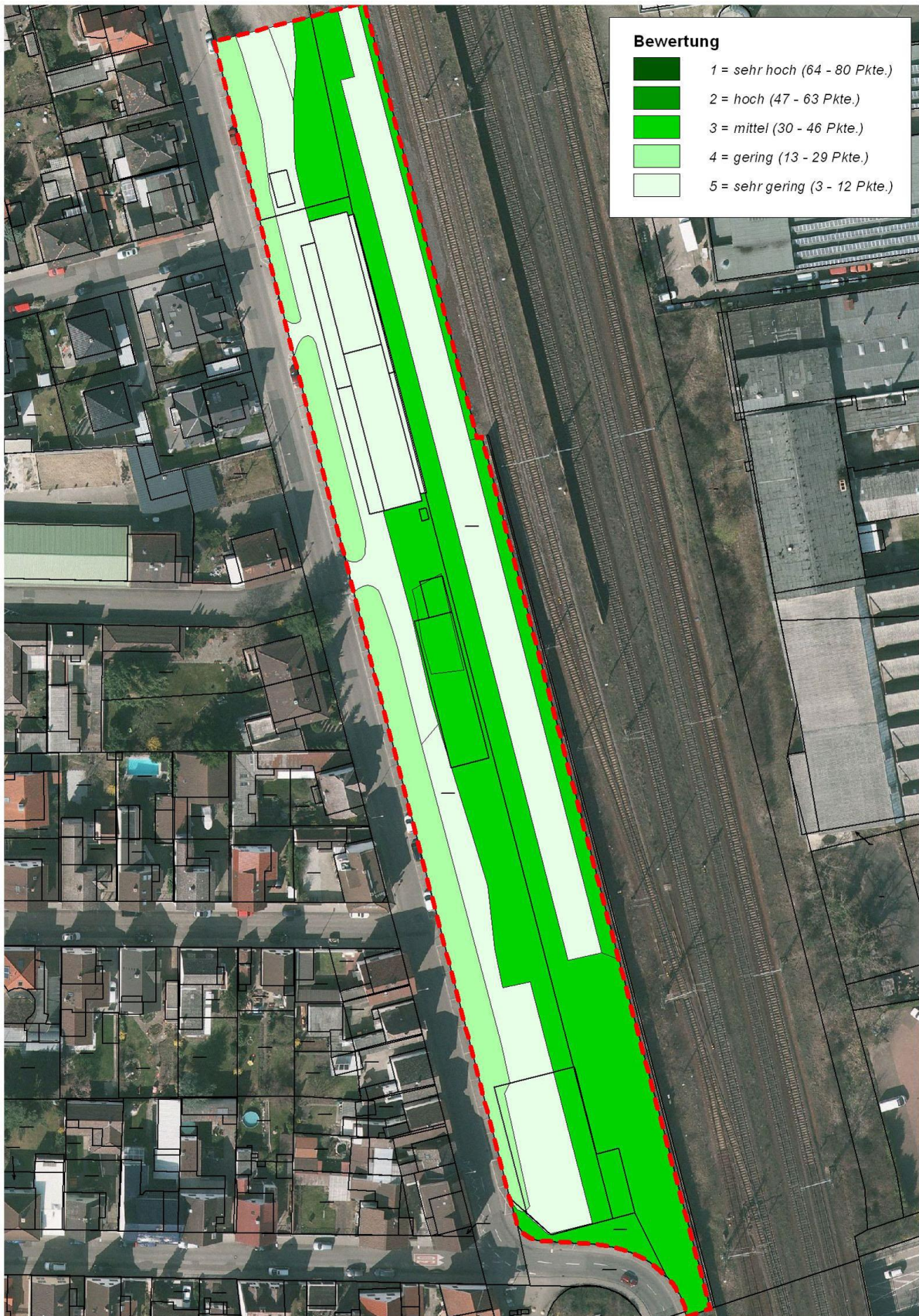
Abb. 12: Wertigkeit der einzelnen Nutzungsformen/Biotope Stand Sept. 2014.