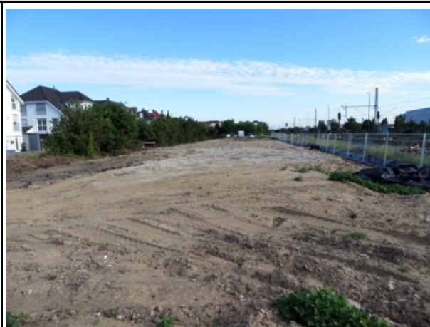
Abb. 7 b: Standort der ehemaligen Lagerhalle 2015.

Die überdachte ehemalige Lagerhalle ist bis unter das Dach offen und hat auf Grund der Massivbauweise nur wenige Nischen, die die Besiedelung für Eulen und Fledermäuse begünstigen. Darüber hinaus wird das Gebäude sowohl tagsüber als auch nachts regelmäßig von Menschen besucht. Diese häufigen Störungen dürften ebenfalls dazu beitragen, dass eine Besiedelung mit Fledermäusen und Eulen unwahrscheinlich ist.