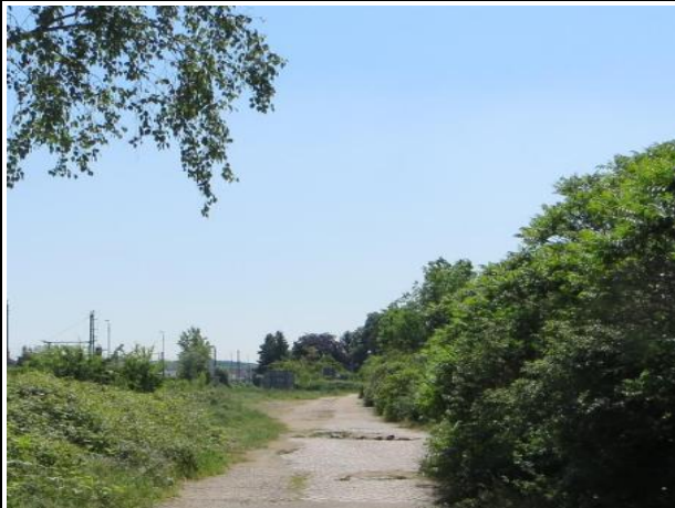
Abb. 5 a: Kopfsteinpflasterweg 2014

Hierbei handelt es sich um Erschließungsweg zur ehemaligen Lagerhalle. Auf den Asphaltflächen ist flächig Müll abgelegt. Der Kopfsteinpflasterweg wurde abgebrochen und die Pflastersteine aufgeschichtet und zum Abtragen bereitgestellt.