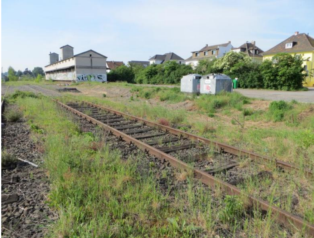
Foto 5: Die abzureißende Halle von Norden nach Süden fotografiert.