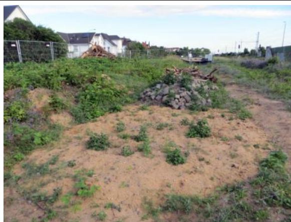
Abb. 2b: Gebüchssukzession mit artenarmem Brombeerbestand 2015.

Die Sukzession ist hier bereits fortgeschritten. Gebiet zwischen der Lärmschutzwand im östlichen Teil und den Gleisen. Wird jährlich gemäht, teilweise werden die aufkommenden Gehölze entfernt. Unter dem Hartriegel befinden sich höhere einzelne Hängebirke und Waldkiefer. Dazu überwiegend mit Brombeeren bewachsene Flächen.