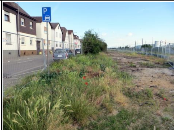
Abb. 3 b: Heckenstreifen Eugen-Schreiber-Straße 2015.

Funktion: Deckungsraum und Nahrungshabitat. Brutplatz von Mönchsgrasmücke, Singdrossel, Grünfink, Amsel, Zilpzalp, Klappergrasmücke, Stieglitz.