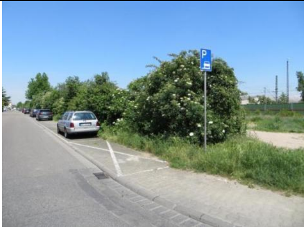
Abb. 3 a: Heckenstreifen Eugen-Schreiber-Straße 2014.

Der Grünstreifen zur Eugen-Schreiber-Straße wurde ursprünglich mit Ziergehölzen (Eschenahorn, Flieder, Gewöhnliche Schneebeere etc.) angelegt und wird inzwischen durch zahlreiche standorttypischen heimischen Gehölzen durchsetzt (wahrscheinlich natürliche Ansamung). Dieser Gehölzstreifen soll gemäß Bauplanung teilweise erhalten bleiben. An den Zufahrtswegen werden Gehölze entfernt. An verschiedenen Stellen wurde immer wieder Müll abgelagert.