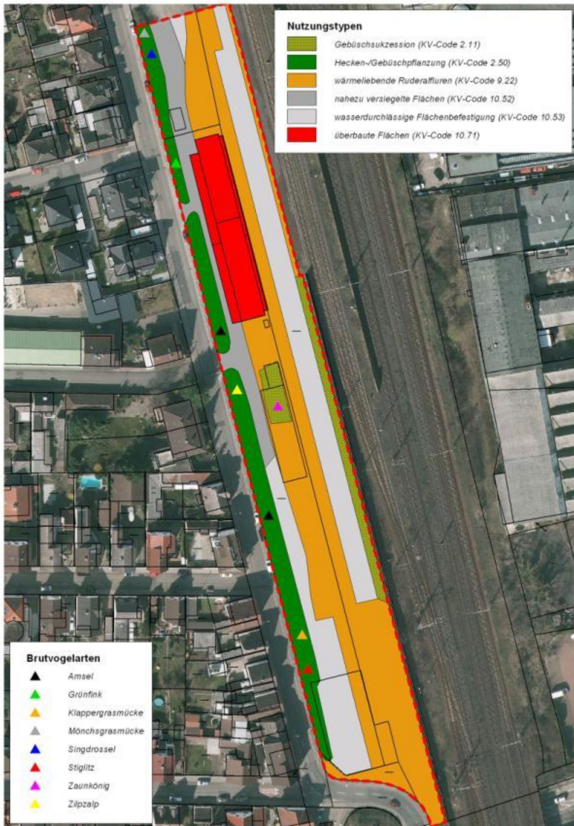
Abb. 11: Brutvögel im Untersuchungsgebiet 2014.