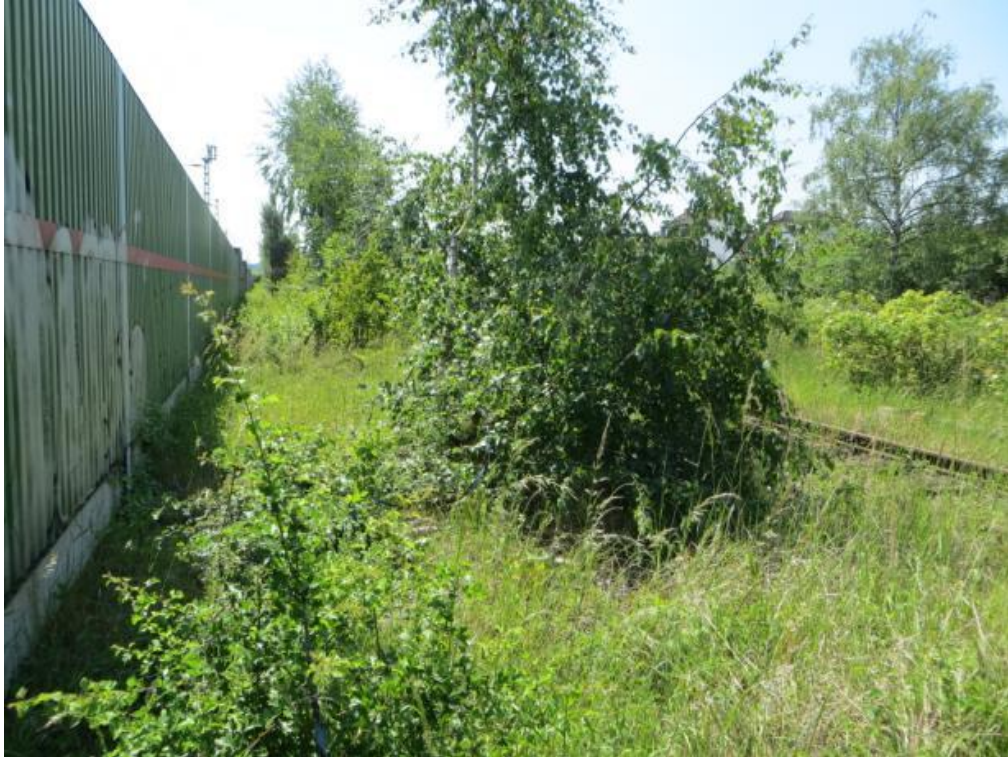
Foto 7: Grünstreifen entlang der Lärmschutzwand im ungemähten Zustand.