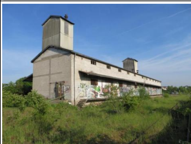
Abb. 7 a: Lagerhalle 2014