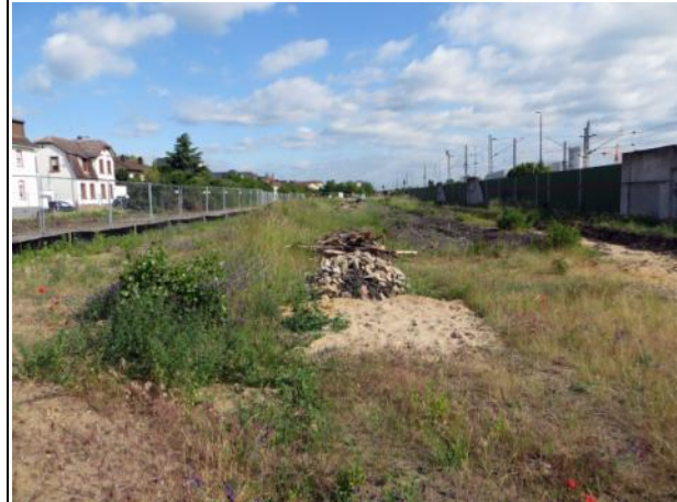
Abb. 4 b: Ruderalfläche mit den temporären Ersatzhabitaten, welche zum Ausgleich für die vorzeitig durchgeführten Maßnahmen 2015 aufgebaut wurden.

Die sandig-kiesigen Ruderalflächen nehmen den größten Teil der Untersuchungsfläche ein. Die Bestände werden überwiegend von mehrjährigen, warme und trockene Wuchsorte bevorzugenden Arten aufgebaut. Sie sind oft lückig ausgebildet und blütenreich. Nachtkerze und Königskerze dominieren in lückigen offenen Bereichen. Sukzessionsbedingt werden die Flächen teilweise von Hängebirke, Brombeere, Hartriegel, Hundsrose u. a. bewachsen.