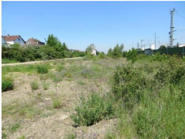
Abb. 4 a: Ruderalflächen 2014