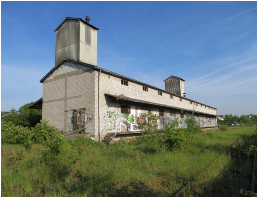
Foto 4: Die abzureißende Halle von Süden nach Norden fotografiert.