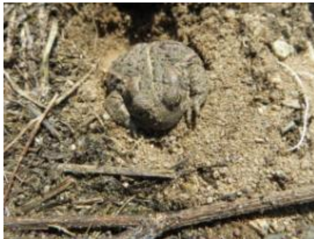
Abb. 9 und 10: Zauneidechse und Kreuzkröte im Untersuchungsgebiet 2014.

Beide Arten gelten als streng geschützt gemäß Anhang IV FFH-RL, die Kreuzkröte wird in Hessen in der Roten Liste als „Gefährdet“ eingestuft (Tab 3).