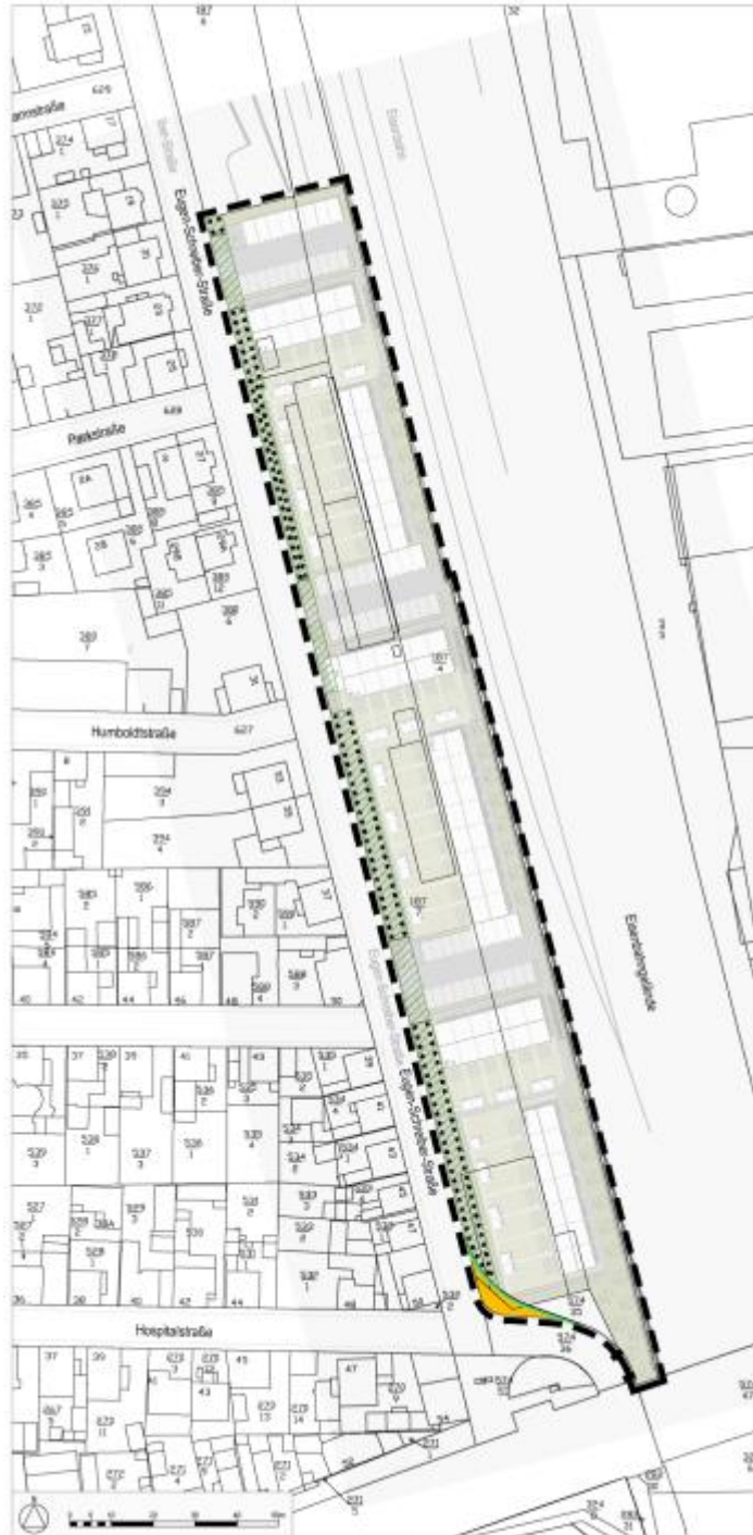
Abb. 1: Lampertheim, Kartengrundlage Stadtplanung+Architektur Fischer (2014).

Der zu untersuchende Bereich ist identisch mit dem Planungsgebiet (Abb. 1). Darüber hinaus wurden bei der Erfassung der Vogelarten und Reptilien die unmittelbar angrenzenden Randzonen mit berücksichtigt, da die Lebensräume dieser Artengruppen sich nicht auf solch kleine Teilareale beschränken.