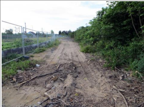
Abb. 5 b: Kopfsteinpflasterweg 2015

Hierbei handelt es sich um Erschließungsweg zur ehemaligen Lagerhalle. Auf den Asphaltflächen ist flächig Müll abgelegt. Der Kopfsteinpflasterweg wurde abgebrochen und die Pflastersteine aufgeschichtet und zum Abtragen bereitgestellt.