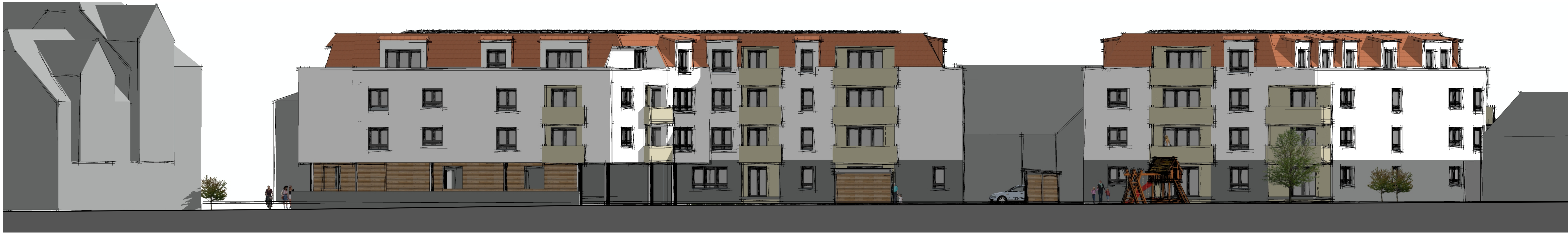
Ansicht auf Ostfassade (parallel zur Wormser Straße)