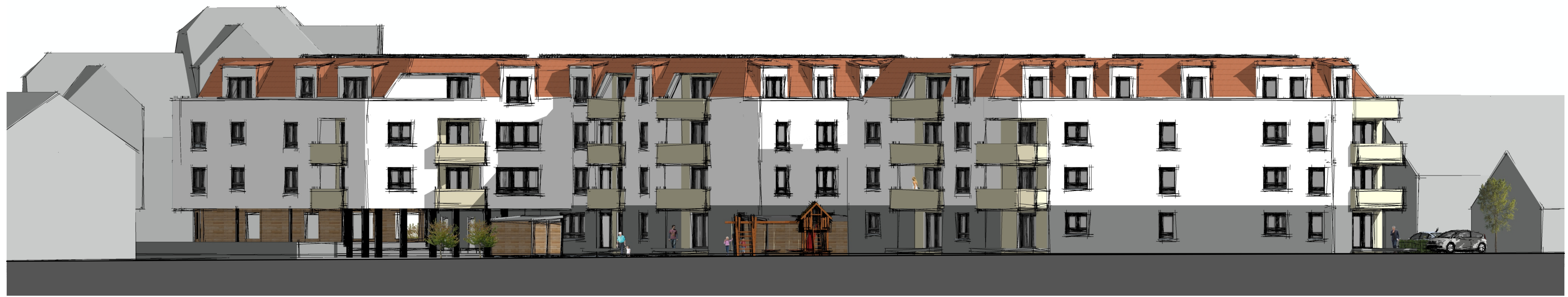
Ansicht auf Nordfassade