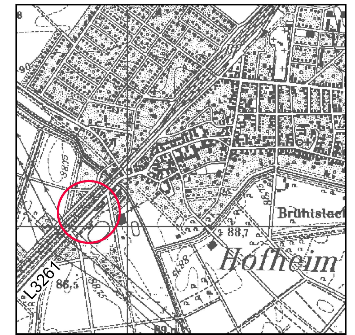
Lage des Geltungsbereiches M1:10.000

Die textlichen Festsetzungen werden nach der öffentlichen Auslegung eingefügt.