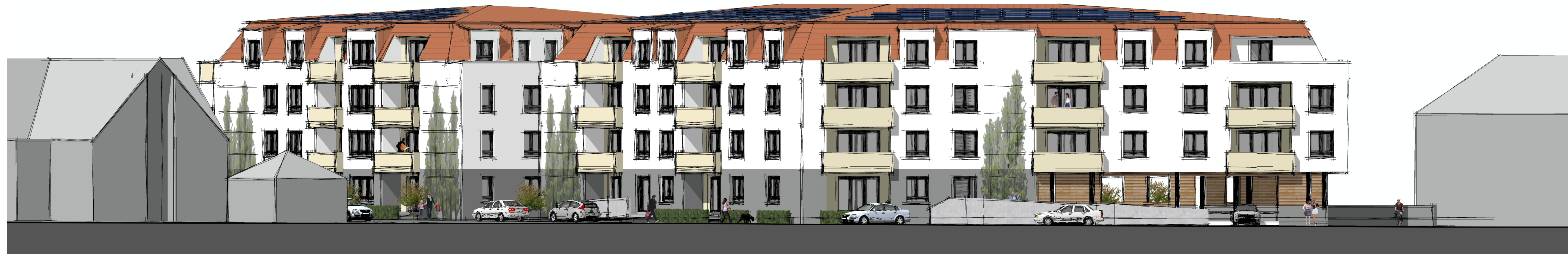
Ansicht auf Südfassade (von Wilhelmstraße)