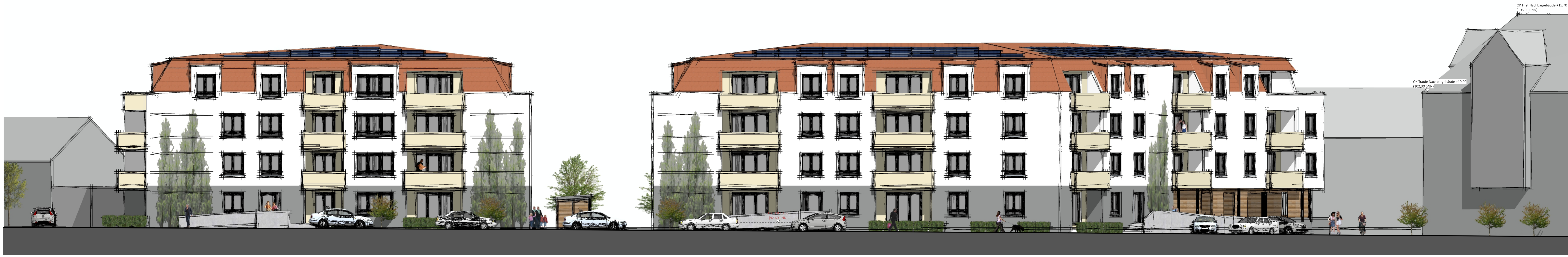
Ansicht auf Westfassade (von Wormser Straße)