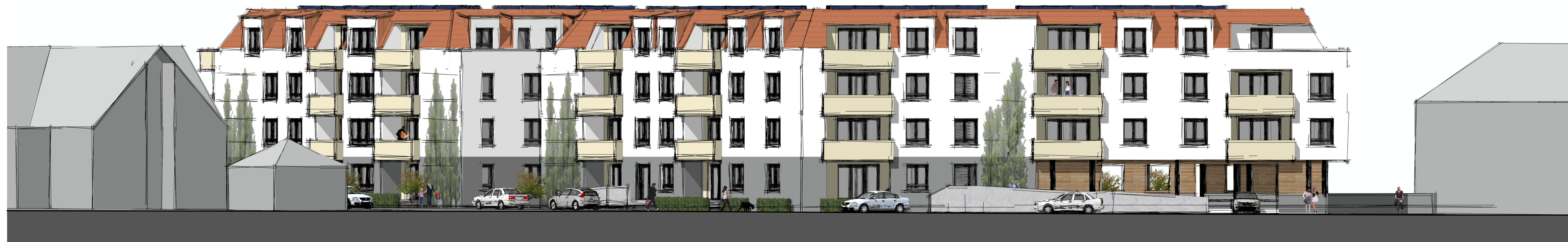
Ansicht auf Südfassade (von Wilhelmstraße)