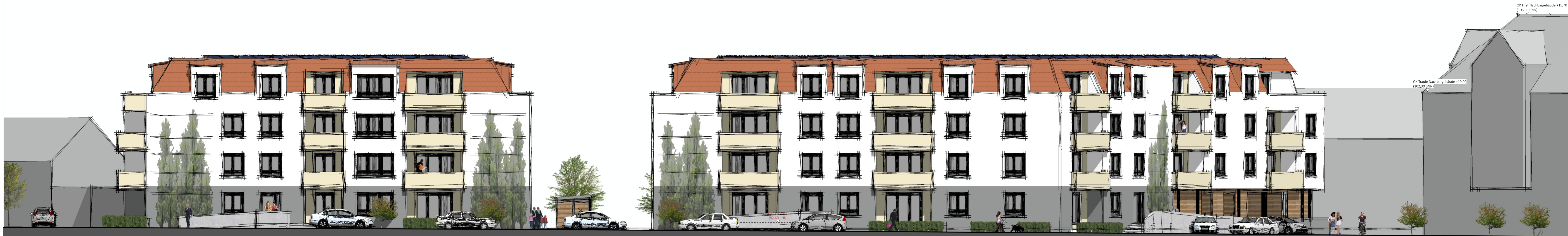
Ansicht auf Westfassade (von Wormser Straße)