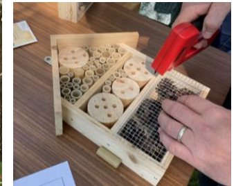
Impressionen Tag der Städtebauförderung am 26.5.2023