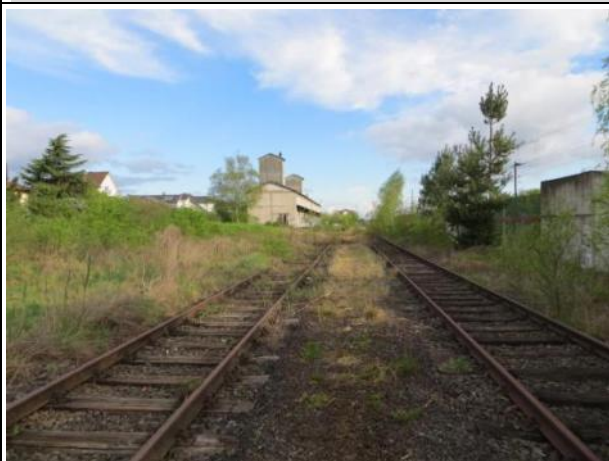
Abb. 6 a: Schotterflächen entlang der ehemaligen Gleise 2014.

Lokalität 5: Schotter-, Kies- u. Sandwege, -plätze oder andere wasserdurchlässige Flächenbefestigung sowie versiegelte Flächen, deren Wasserabfluss versickert wird KV-Code: 10.530 KV-Wertpunkte (m 2 ): 6 Flächengröße: 0,2529 FFH: LRT: nein HB-Code: nein