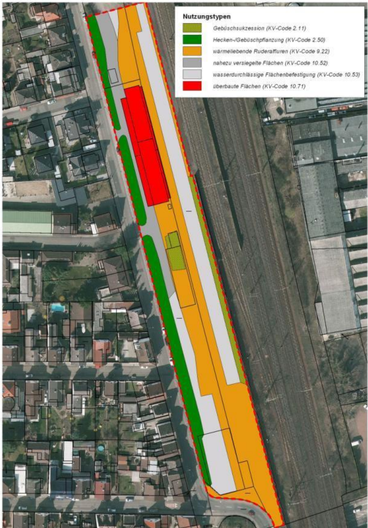
Abb. 2: Nutzungs- bzw. Biototypen im Untersuchungsgebiet 2014.