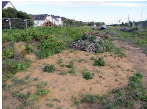
Abb. 2b: Gebüchsukzession mit artenarmem Brombeerbestand 2015.

Die Sukzession ist hier bereits fortgeschritten. Gebiet zwischen der Lärmschutzwand im östlichen Teil und den Gleisen. Wird jährlich gemäht, teilweise werden die aufkommenden Gehölze entfernt. Unter dem Hartriegel befinden sich höhere einzelne Hängebirke und Waldkiefer. Dazu überwiegend mit Brombeeren bewachsene Flächen.