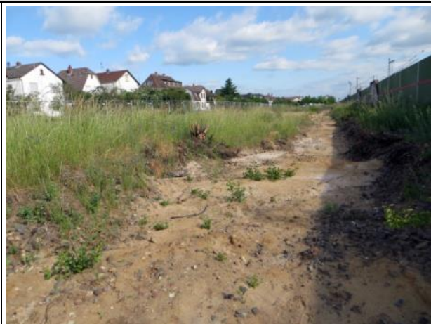
Abb. 6 b: Schotterflächen entlang der ehemaligen Gleise 2015.

Kies- und Sandwege befinden sich am westlichen Rand des Gebietes in südlicher Verlängerung der Asphaltflächen an der Lagerhalle. Die im Luftbild erkennbaren befestigten Flächen im Süden des Areals sind entfernt worden und entsprechen dem hier beschriebenen Nutzungstyp. Dieser Bereich wird aktuell als Fußweg, insbes. als Hundeauslauf genutzt. Die Schotterflächen der beiden Gleise sind nur schwach bewachsen und von deutlicher lückiger Struktur. Auch dieser Bereich dient der Zauneidechse als Lebensraum.