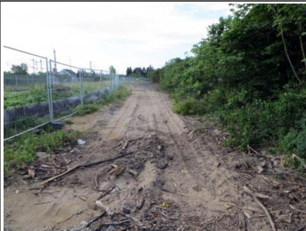
Abb. 5 b: Kopfsteinpflasterweg 2015

Hierbei handelt es sich um Erschließungsweg zur ehemaligen Lagerhalle. Auf den Asphaltflächen ist flächig Müll abgelegt. Der Kopfsteinpflasterweg wurde abgebrochen und die Pflastersteine aufgeschichtet und zum Abtragen bereitgestellt.