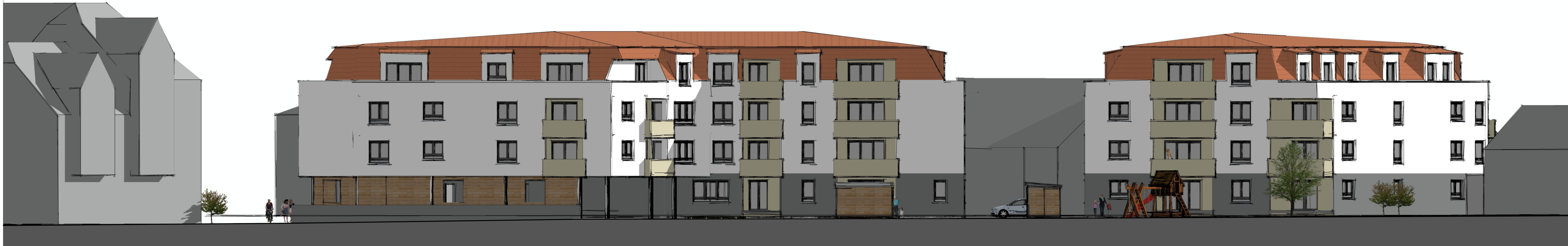
Ansicht auf Ostfassade (parallel zur Wormser Straße)