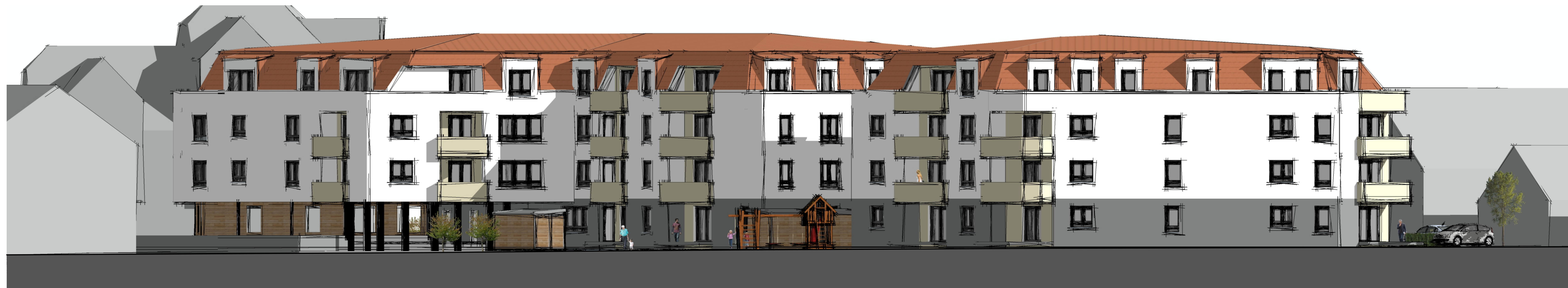
Ansicht auf Nordfassade