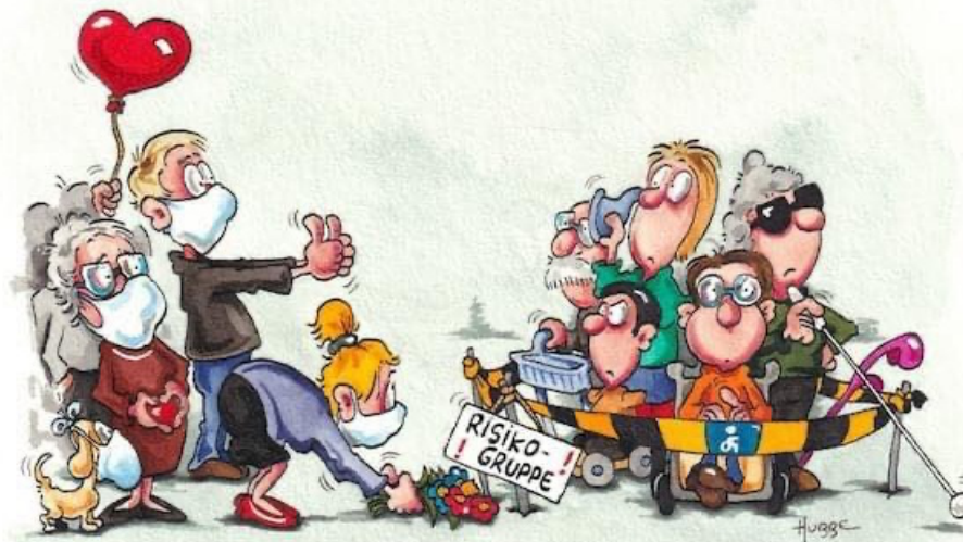
INKLUSION IN ZEITEN DER PANDEMIE