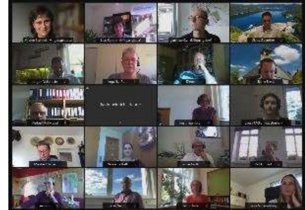
Konferenztool mit Plenum und Kleingruppen