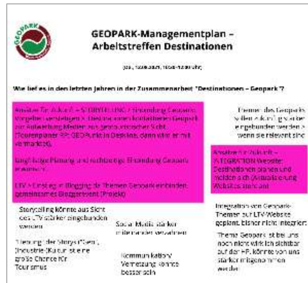
Gemeinsames Arbeiten am digitalen Whiteboard