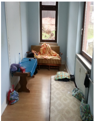
Zimmer untere Etage