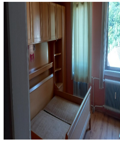
Zimmer obere Etage