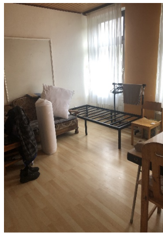
Zimmer obere Etage