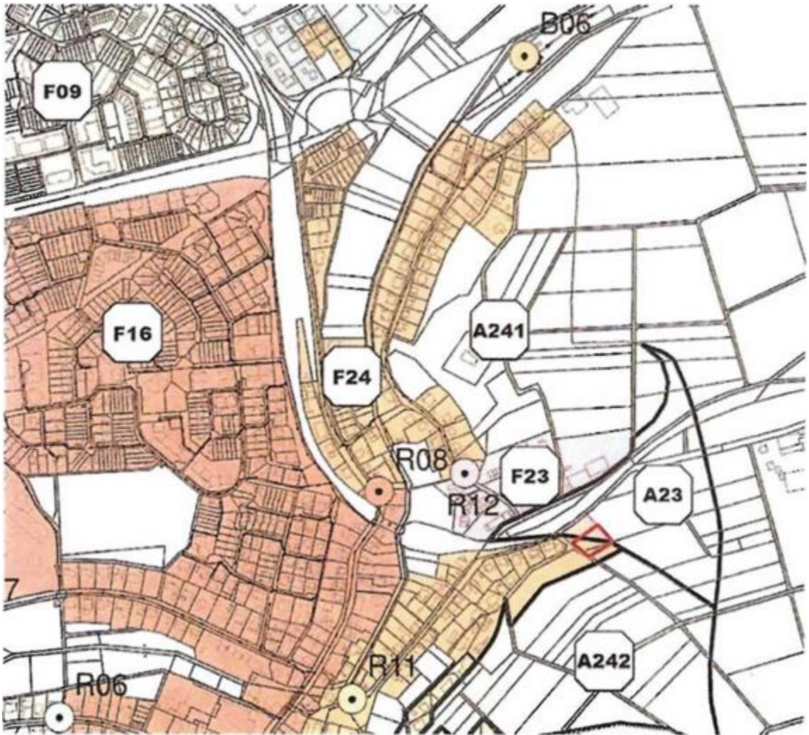
Abbildung 2: Ausschnitt Übersichtslageplan Einzugsgebiete SMUSI 2010 - Prognosezustand (DAR) [2]

Gemäß den Ergebnissen der bisherigen SMUSI-Prognose 2010 [2, 3] lag das o.g. Regenüberlaufbauwerk R11 „Stockheimer Grund“ unter den folgenden maximal zulässigen Richtwerten: