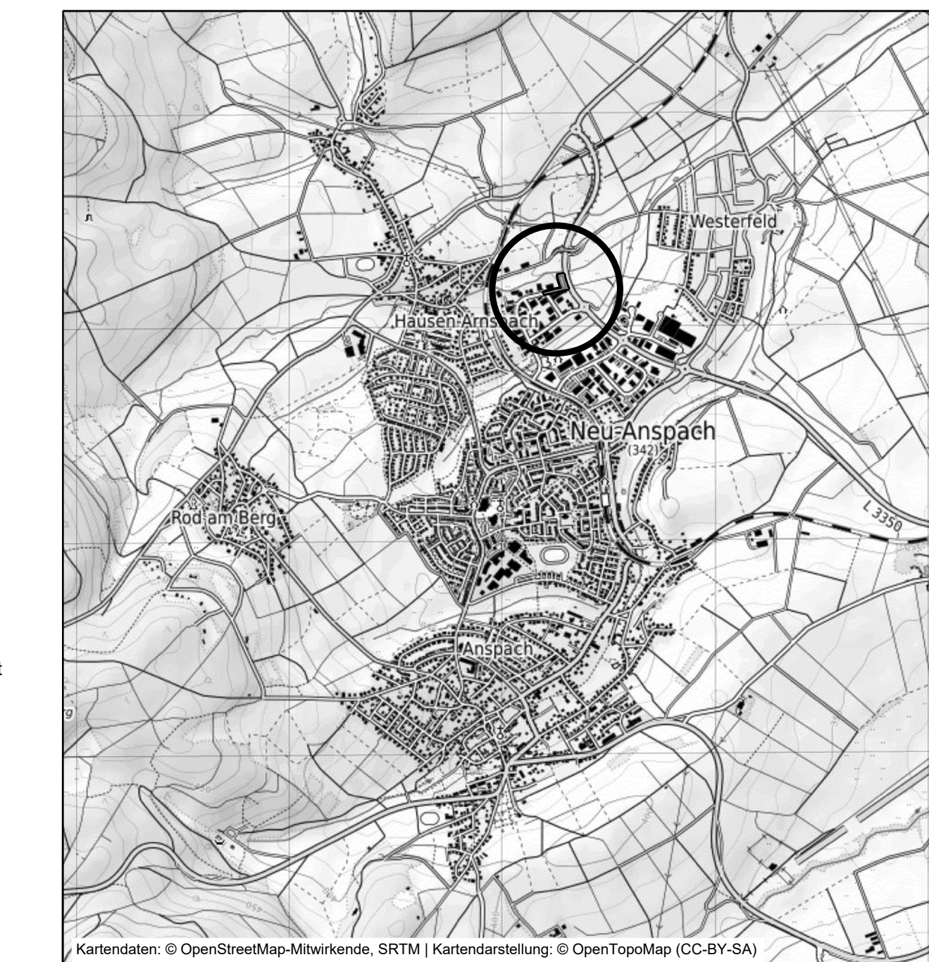
Übersichtskarte (Maßstab 1 : 25.000)

Kartendaten: © OpenStreetMap-Mitwirkende, SRTM | Kartendarstellung: © OpenTopoMap (CC-BY-SA)