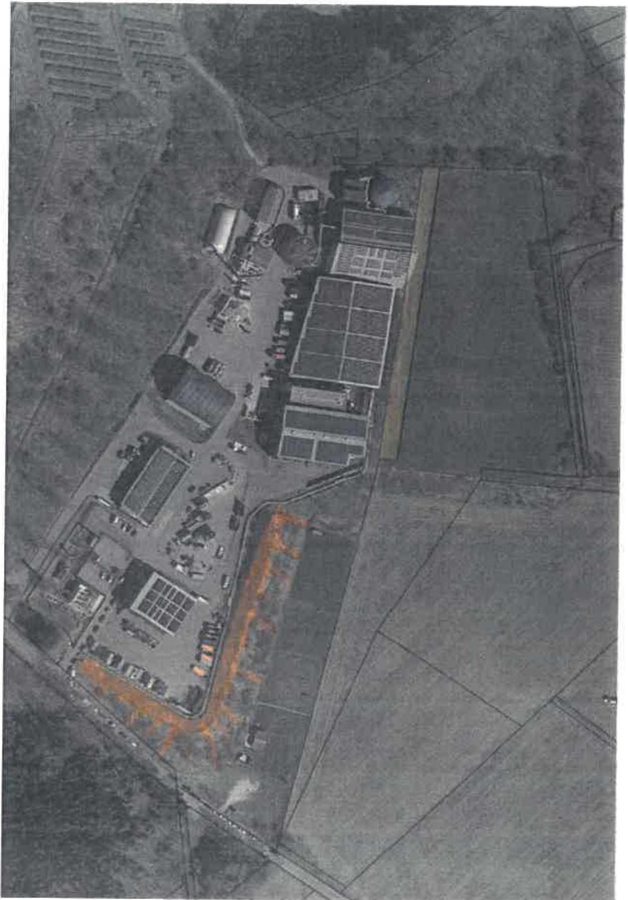
Deponie Brandholz Zusatzmaßnahme: Obstbaum- und Pflegefläche