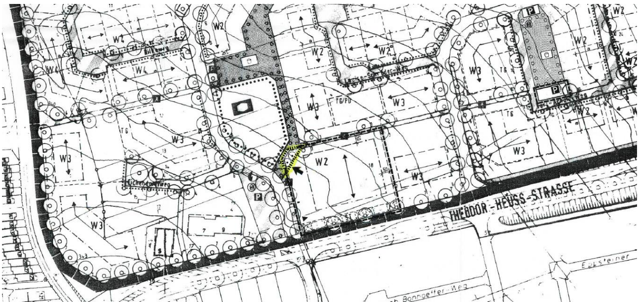
Abb. 2: Ausschnitt Bebauungsplan Bereich „Mitte Ost“ Nr. 22/I 5. Änderung: Gebiet Nord (unmaßstäblich)

Bereits 1987 wurde der Ursprungsbebauungsplan Bereich „Mitte-Ost“, Nr. 22/I, Gebiete Nord + Süd rechtskräftig. In den Jahren 1992, 1994, 1998 sowie 2000 wurden Teilbereiche des Gebiets Nord durch insgesamt 5 Änderungen des Bebauungsplanes angepasst.