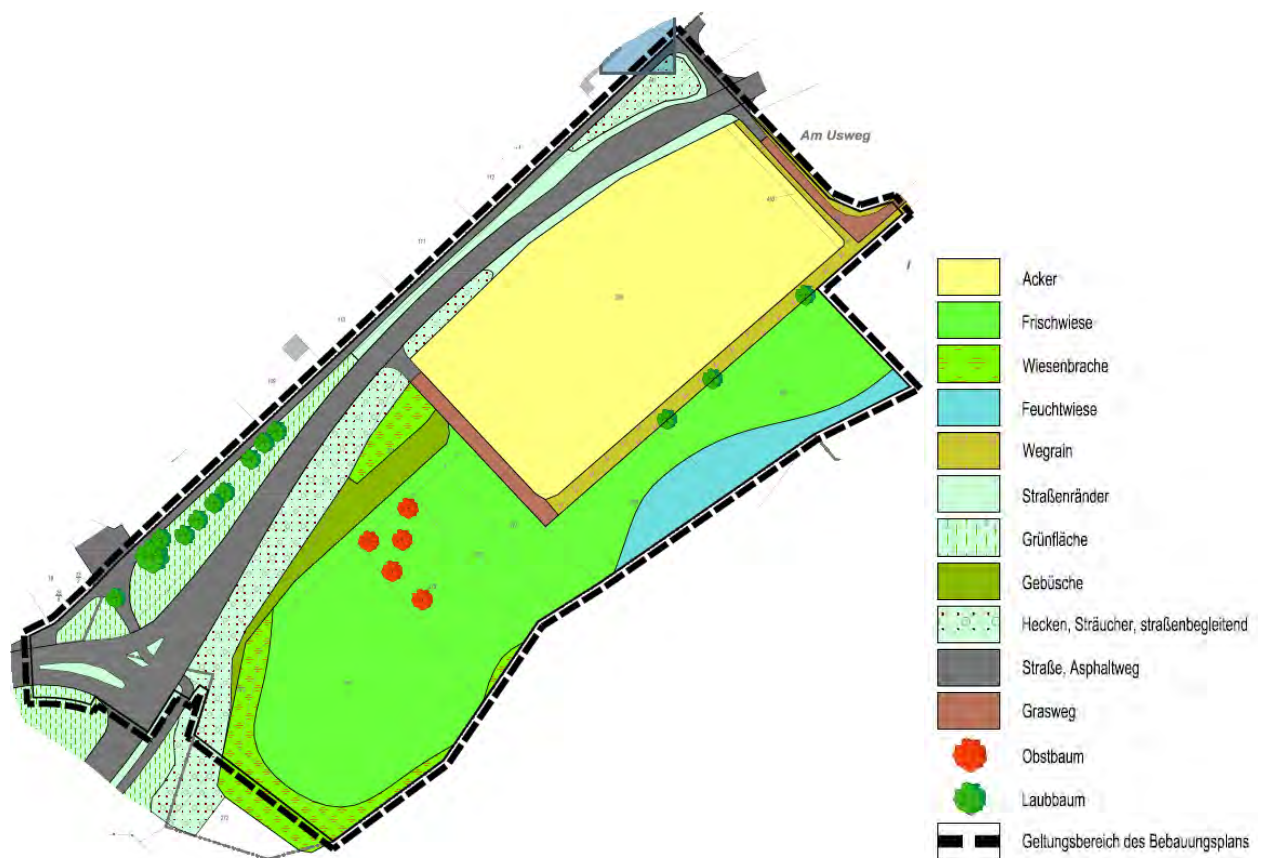
Abb. 1: Bestandskarte Bebauungsplan „EDEKA“ der Stadt Neu-Anspach.

Die Stadt Neu-Anspach betreibt die Aufstellung eines Bebauungsplans zur Ausweisung weiterer Gewerbeflächen. Der räumliche Geltungsbereich umfasst eine Fläche von rund 3,1 ha im Osten von Neu-Anspach. Geplant ist die Ansiedlung eines EDEKA-Marktes im südwestlichen Teil des Geltungsbereichs. Der Nordosten des Plangebiets ist ebenfalls Gewerbefläche, während im Südosten eine Kompensationsfläche Teil des Geltungsbereichs ist (Abb. 1).