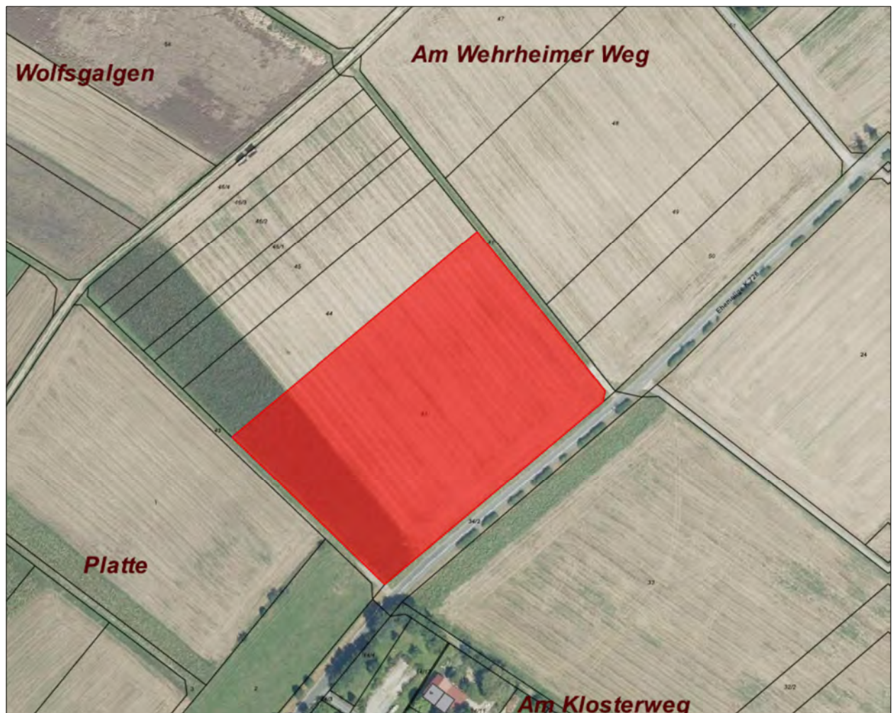
Abb. 8: Lage der Ausgleichsfläche (rot markiert) zur Entwicklung eines Extensivackers (M3).

Die für den artenschutzrechtlichen Ausgleich vorgesehene Ackerfläche liegt in der Feldflur östlich von Anspach auf Flurstück 42 in Flur 21 der Gemarkung Anspach und umfasst rd. 1,5 ha (s. Abb. 8).