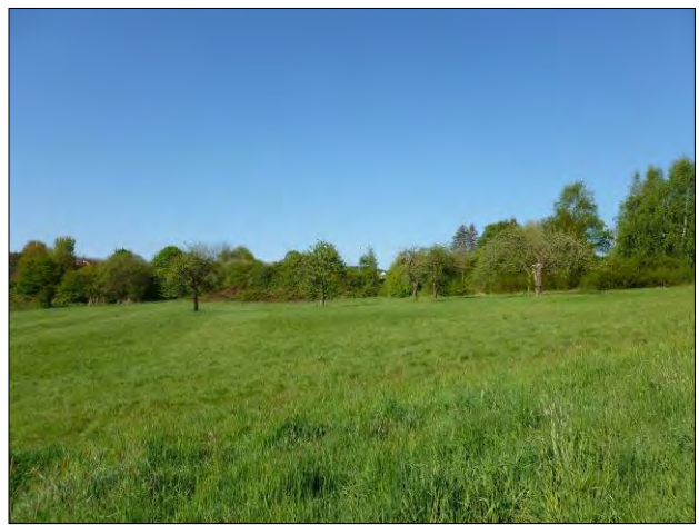
Abb. 3: Wiese mit Obstbaumbestand.