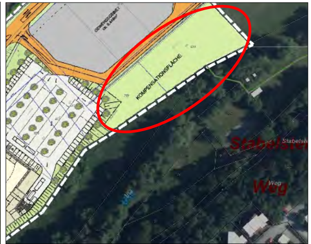
Abb. 5: Lage der Kompensationsfläche (rot umkreist) an der Aue der Usa.