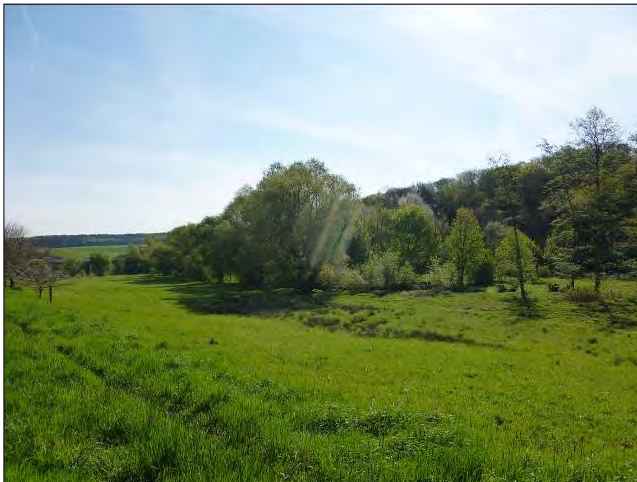
Abb. 4: Übergang zur Usa-Aue mit Feucht-Wiese.