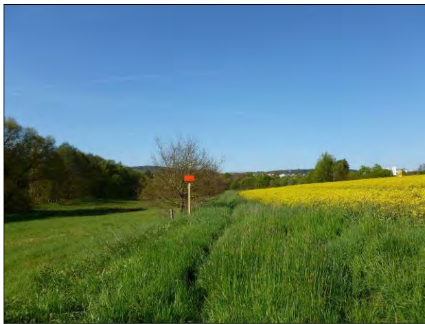
Abb. 2: Lage des Eingriffsgebiets oberhalb der Usa-Aue.

Für die Umsetzung dieses neuen Gewerbegebiets wird die bestehende Hanglage überformt, so dass ein Plateau unterhalb des Niveaus der Landstraße entsteht. Dafür sind entsprechende Erdarbeiten notwendig, um den Hang an der Straße abzutragen und in Richtung Aue aufzufüllen.