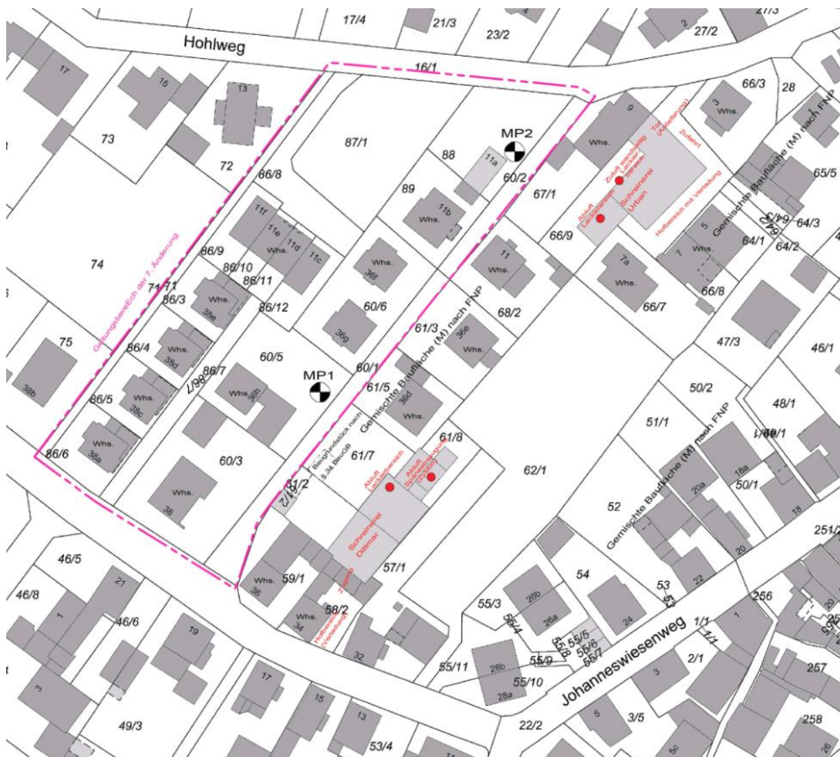
Abb. 2: Auszug aus dem Lageplan in Anlage 1, unmaßstäblich

Neben Wohngebäuden in einer dörflichen Struktur sind hier entsprechend dem Lageplan im Maßstab 1: 1.000 in der Anlage 1, der als Ausschnitt in der folgenden Abb. 2 dargestellt ist, die beiden Schreinereien Rainer Dittmar im Johanneswiesenweg 34 und Jacob Urban & Söhne im Hohlweg 7 angesiedelt; im direkten Anschluss an den östlichen Geltungsbereich wurden zudem auf der Grundlage des § 34 Abs. 1 BauGB in jüngster Vergangenheit die beiden Wohnhäuser Johanneswiesenweg Nr. 36d und Nr. 36e genehmigt.