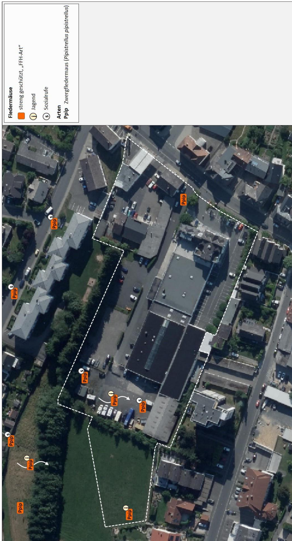
Abb. 4: Nachweise der Fledermäuse im Planungsraum im Jahr 2017.