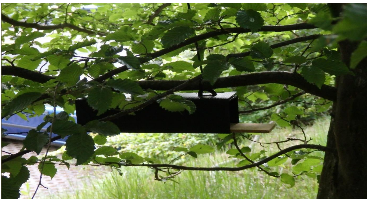
Abb. 5: Nesting-Tube (Beispiel).

Hierbei handelt es sich um ca. 25 cm lange Röhren, die an einer Seite verschlossen sind (Abb. 5). Haselmäuse und andere Bilche nutzen diese gerne als Zwischenquartiere und legen dort kleine Nester an. Da Haselmäuse tagsüber schlafen, können die Tiere durch eine Kontrolle am Tage leicht erfasst werden. Die Bilche wurden im Zeitraum von April bis Juli 2017 untersucht (Tab. 9). Die Standorte, an denen am 24.04.2017 Nesting-Tubes installiert wurden, zeigt Abbildung 6.