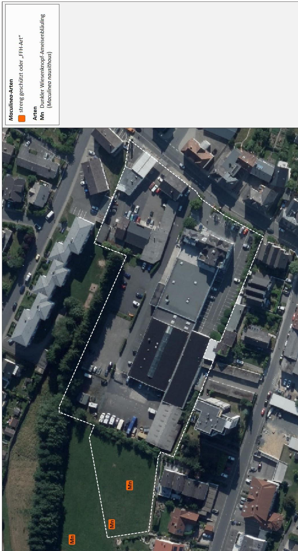
Abb. 7: Maculinea nausithous im Planungsraum 2017 (Bildquelle: Hessisches Ministerium für Umwelt, Klimaschutz, Landwirtschaft und Verbraucherschutz, aus natureg-hessen.de, 01/2019).