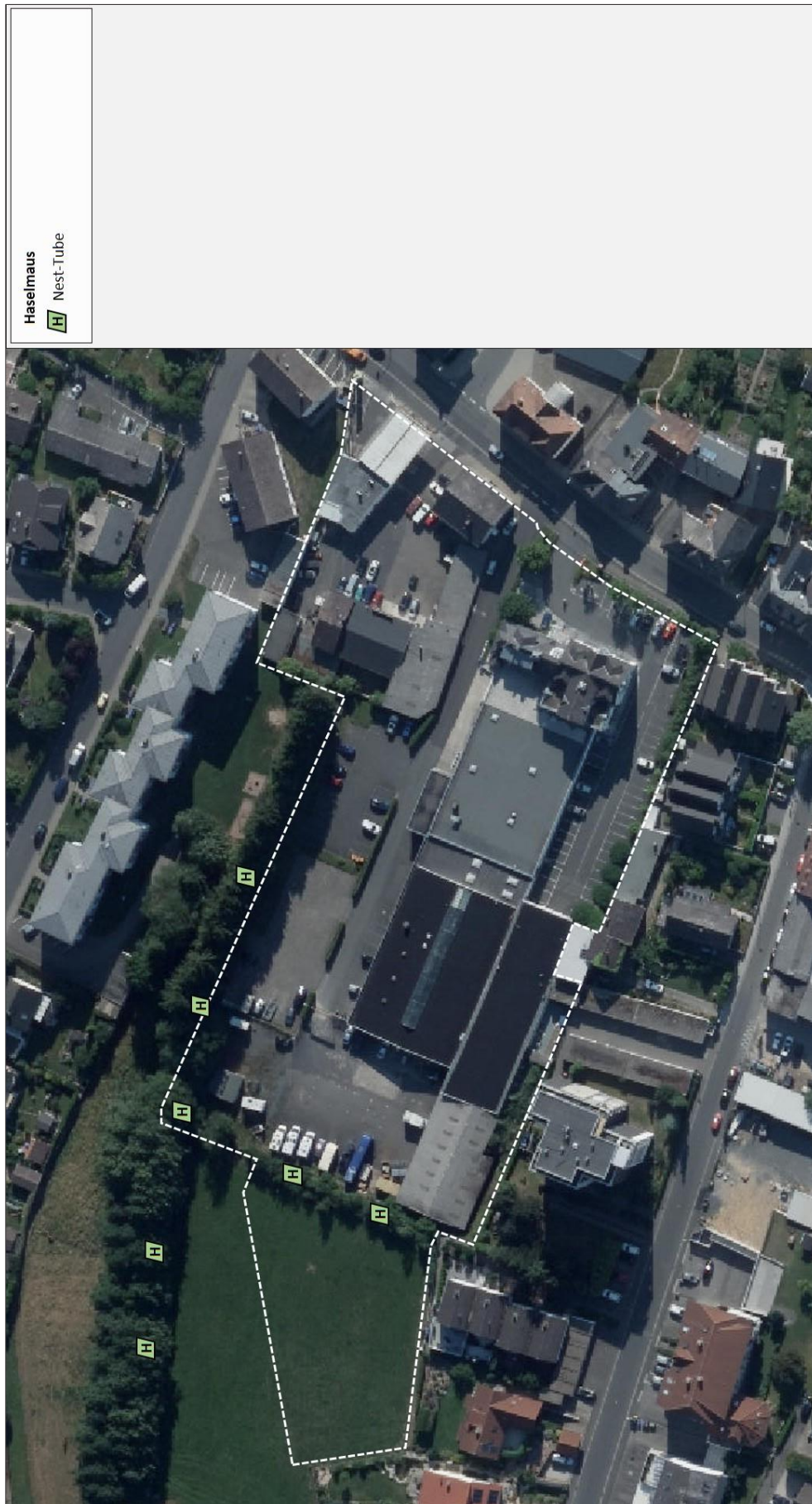
Abb. 6: Nesting-Tubes zum Nachweis der Haselmaus im Planungsraum im Jahr 2017.