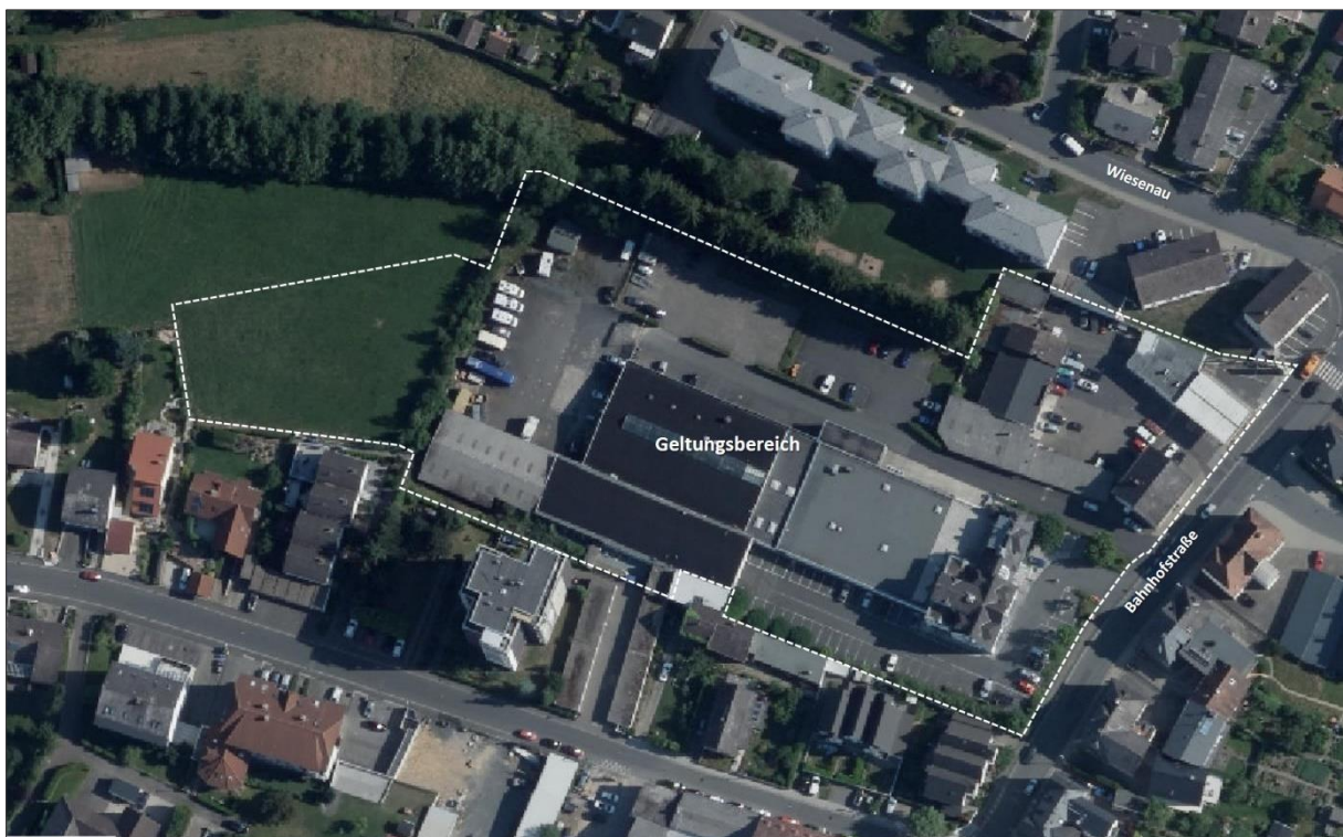
Abb. 1: Abgrenzung des Geltungsbereichs „60-15-12 Bebauungsplan Bahnhofstraße 71-73“; Stadt Neu-Anspach, Stadtteil Anspach (Bildquelle: Hessisches Ministerium für Umwelt, Klimaschutz, Landwirtschaft und Verbraucherschutz, aus natureg-hessen.de, 01/2019).

Der Bericht liefert Aussagen zur angetroffenen Fauna, deren artenschutzrechtlichem Status und hebt wichtige Strukturelemente im Planungsraum hervor. Quantifizierende Aussagen zu notwendigen Vermeidungs- und Kompensationsmaßnahmen sind in den Prüfbögen festgelegt.