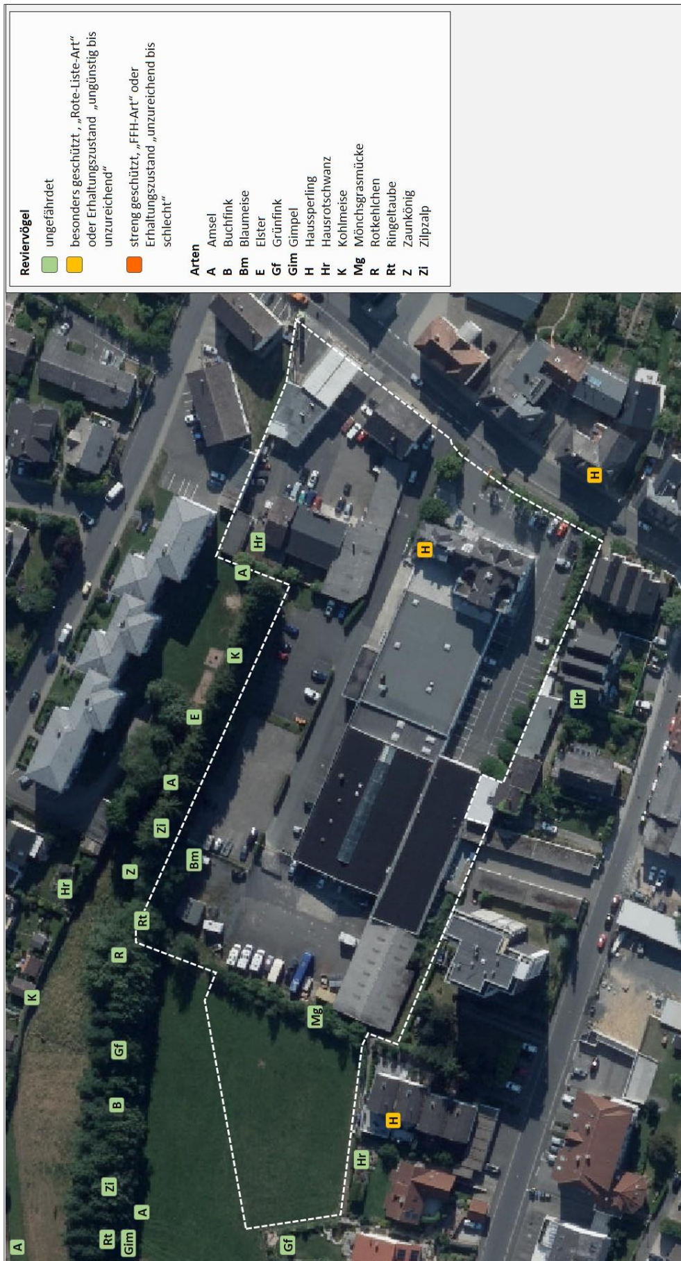
Abb.2: Reviervogelarten im Planungsraum 2017 (Bildquelle: Hessisches Ministerium für Umwelt, Klimaschutz, Landwirtschaft und Verbraucherschutz, aus natureg-hessen.de, 01/2019).