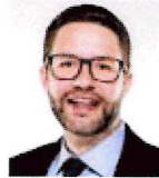
Landrat Thorsten Stolz