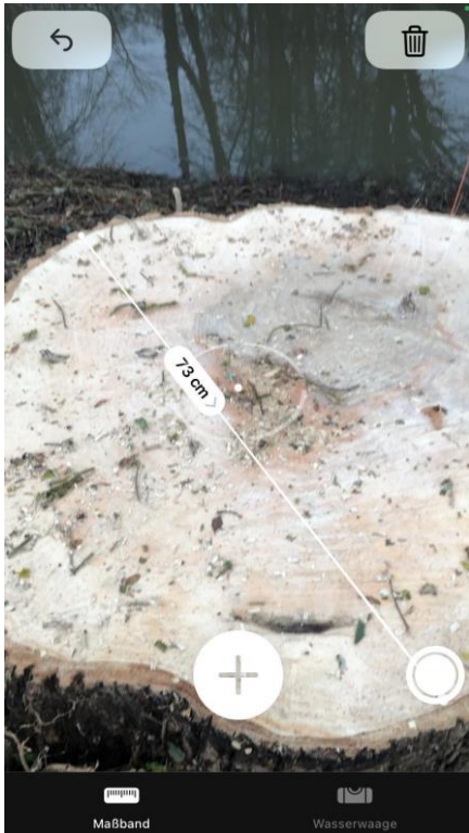
1.Maß Baum Spielplatz