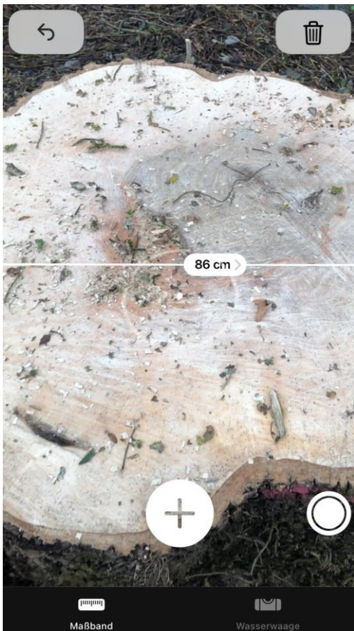
2.Maß Baum Spielplatz