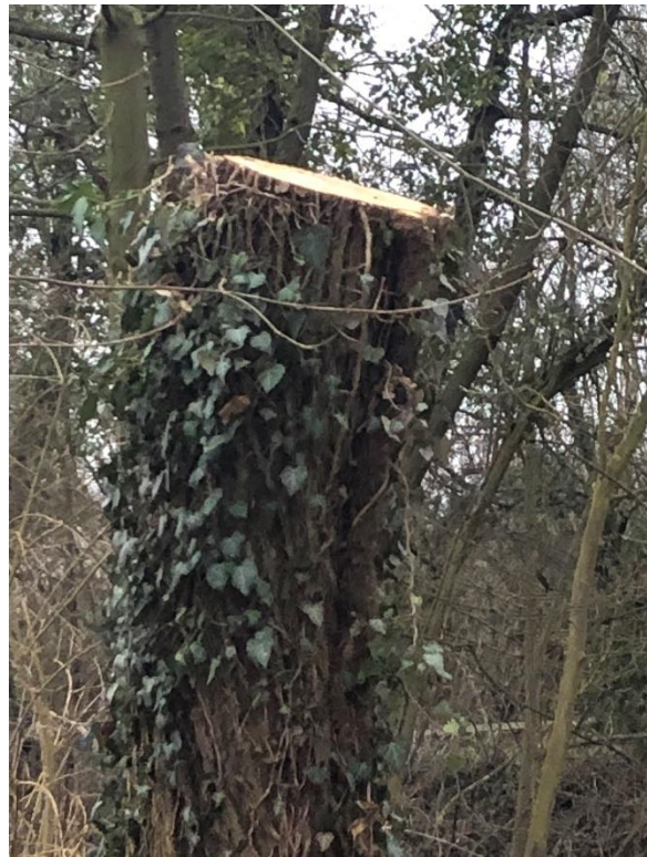
Baum Spielplatz Bahnhofsstraße