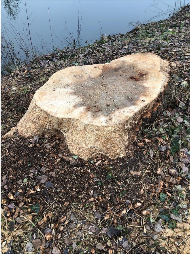
Baum an der Nidder hinter Pfarrgarten Bahnhofstraße