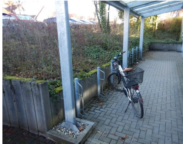
Abbildung 12: Überdachte Abstellanlagen an der Stadtverwaltung Nidderau.