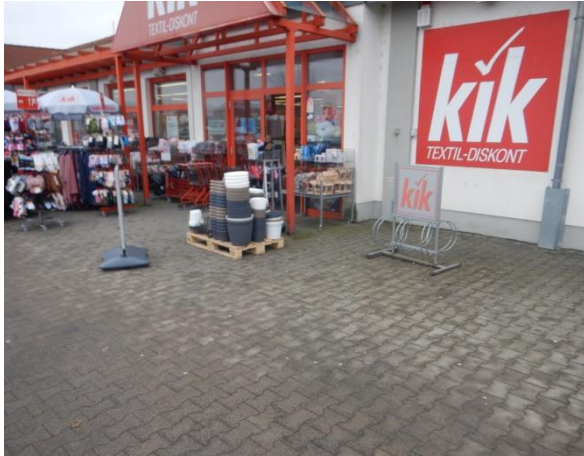
Abbildung 9: Ungeeignete Vorderradhalter an einem Kik in Heldenbergen.