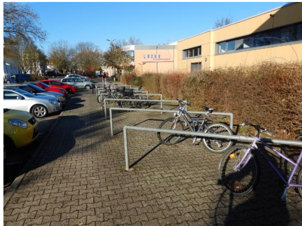
Abbildung 15: Keine Abstellanlagen an der Mehrzweckhalle in Erbstadt.

Neben den Bürgerhäusern in Nidderau, die teilweise auch als Sporthallen genutzt werden (siehe Kapitel 2.3), sind als Sport- und Freizeiteinrichtungen insbesondere das Nidderbad und die verschiedenen Sportvereine in Nidderau zu nennen. Während das Nidderbad über Anlehnbügel in modernem Standard verfügt (siehe Abbildung 15), konnten an den Sportvereinen entlang des Zielnetzes keine Radverkehrsanlagen festgestellt werden.