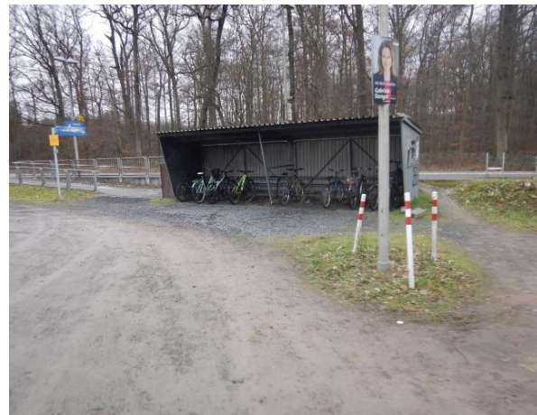
Abbildung 6: Veraltetes, ungeeignetes Modell am Bahnhof Nidderau-Eichen