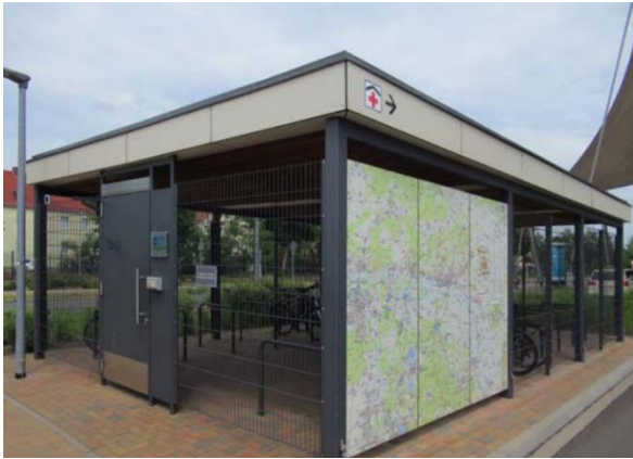
Abbildung 3: Sammelschließgarage

Durch die hohe Parkdauer an Bahnhöfen, teilweise auch über Nacht, ist hier der Diebstahl- sowie Wetterschutz besonders relevant. Neben frei zugänglichen Anlagen sollten hier auch gesicherte Angebote für höherwertige Fahrräder (z.B. Pedelecs) geschaffen werden. Sammelschließgaragen (siehe Abbil-