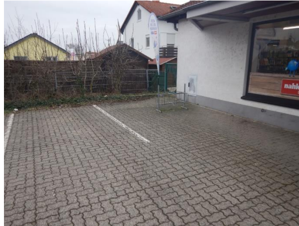
Abbildung 10: Ungeeignete Vorderradhalter an einem Nahkauf in Ostheim.