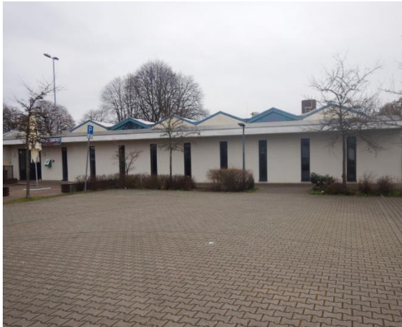
Abbildung 11: Keine Abstellanlagen an der Mehrzweckhalle in Erbstadt.

An den meisten öffentlichen Einrichtungen der Stadt Nidderau sind Abstellanlagen vorhanden. An der Stadtverwaltung sind sowohl überdachte Stellplätze für Mitarbeitende als auch Anlehnpfosten für Besucherinnen und Besucher vorhanden (siehe Abbildung 12). Etwa die Hälfte der Bürgerhäuser verfügt über Abstellanlagen in ausreichendem Standard (siehe Abbildung 13). An der Kultur- und Sporthalle in Heldenbergen sind nur ungeeignete Vorderradhalter zu finden (siehe Abbildung 14). Aufgrund dessen finden sich in der Umgebung zum Erhebungszeitpunkt auch wild abgestellte Fahrräder. Einzig an der Mehrzweckhalle in Erbstadt sind keine Abstellanlagen vorhanden (siehe Abbildung 11).