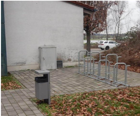
Abbildung 13: Kombinierte Vorderradhalter mit Anlehnbügel an der Nidderhalle in Eichen.