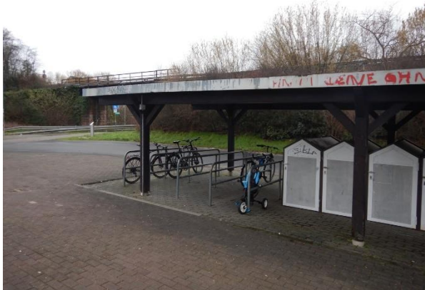
Abbildung 5: Abstellanlagen mit Überdachung und Fahrradboxen