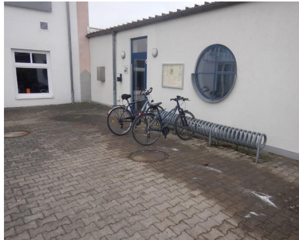
Abbildung 14: Ungeeignete Vorderradhalter an der Kultur- und Sporthalle Heldenbergen.