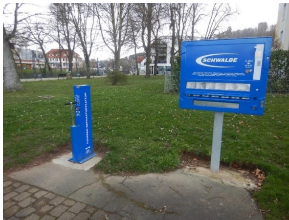
Abbildung 17: Reparaturstation mit Schlauchautomat in Bad Soden.

In Nidderau existiert derzeit keine Reparaturstation. Es wird empfohlen, diese an zentralen Plätzen oder Schnittpunkten zwischen Freizeitrouten und Alltagsverbindungen zu errichten. Als Beispiel für eine gelungene Reparaturstation kann die in Bad Soden bestehende Reparaturstation am hessischen Radfernweg R3 dienen (siehe Abbildung 17). Die Kombination mit einem Schlauchautomaten ermöglicht zudem, dass die meisten Reparaturen schnell durchgeführt werden können.