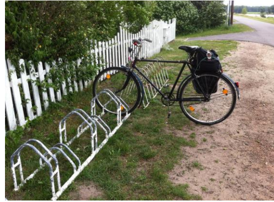
Abbildung 2: Typ Einfacher Vorderradhalter (ungeeignet)

Grundsätzlich sind Fahrradstellplätze mit Anlehnbügeln (siehe Abbildung 1) auszustatten. Diese bieten sowohl eine gute Standfestigkeit als auch ein komfortables und sicheres Anschließen des Fahrrads. Sie entsprechen dem modernen Standard. Ungeeignet, aber weit verbreitet, ist der Abstelltyp einfacher Vorderradhalter (umgangssprachlich auch „Felgenklemmer“ genannt, siehe Abbildung 2). Dieser ermöglicht kein sicheres Anschließen des Fahrrads, bietet keine Standfestigkeit und führt beim Umfallen des Fahrrads zu Schäden an den Laufrädern.