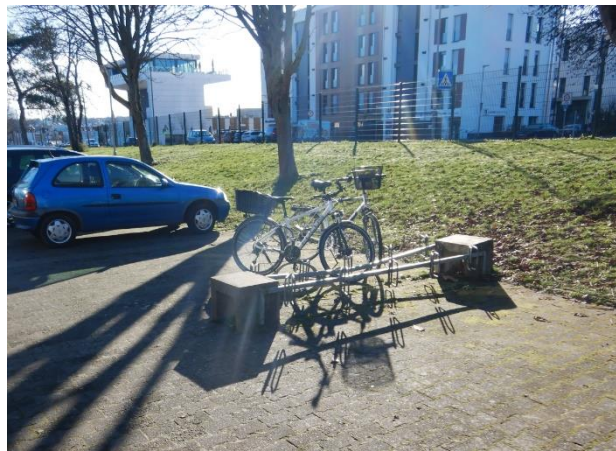
Abbildung 16: Unzureichende Vorderradhalter an der Bertha-von-Suttner-Schule.

An weiterführenden Schulen sollten dagegen Abstellanlagen in hoher Zahl und, aufgrund der langen Standdauer, auch mit Überdachung vorhanden sein. In Nidderau existiert eine weiterführende Schule, die Bertha-von-Suttner-Schule in Heldenbergen. Auf dem Schulgelände existieren nur Vorderradhalter in sehr geringer Zahl (siehe Abbildung 16). Weitere Abstellanlagen konnten nicht festgestellt werden.