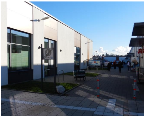
Abbildung 7: Anlehnbügel an der „Neuen Mitte“ in Heldenbergen.

In Nidderau sind nur vereinzelt Abstellanlagen an Einzelhandel, Gastronomie, Dienstleistungen oder Supermärkten zu finden. Die „Neue Mitte“ in Heldenbergen stellt eine Ausnahme dar. Hier sind ausreichend Anlehnbügel vorhanden. Daneben verfügen Geschäfte in Nidderau nur vereinzelt über Fahrradabstellanlagen (siehe Abbildung 8). Die meisten Geschäfte verfügen über keine Abstellanlagen, oder Abstellanlagen in einem unzureichenden Standard (siehe Abbildung 9 und Abbildung 10).