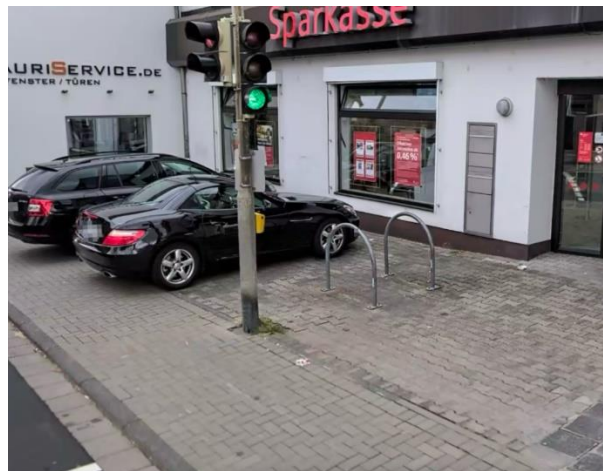
Abbildung 8: Anlehnbügel an einer Sparkasse in Ostheim.