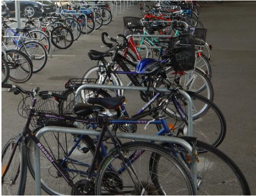
Abbildung 1: Typ Anlehnbügel (geeignet)

Grundvoraussetzungen für jede Fahrradabstellanlage ist die schnelle und barrierefreie Erreichbarkeit sowie ein asphaltierter oder gepflasterter Untergrund. Ebenfalls gewährleistet werden muss eine ausreichend bemessene Stellfläche pro Rad (1,5 m 2 ) und eine Anschließmöglichkeit, die keine Schäden an Fahrrädern verursacht.