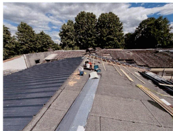
TSG Niederdorfelden 1921 e.V.