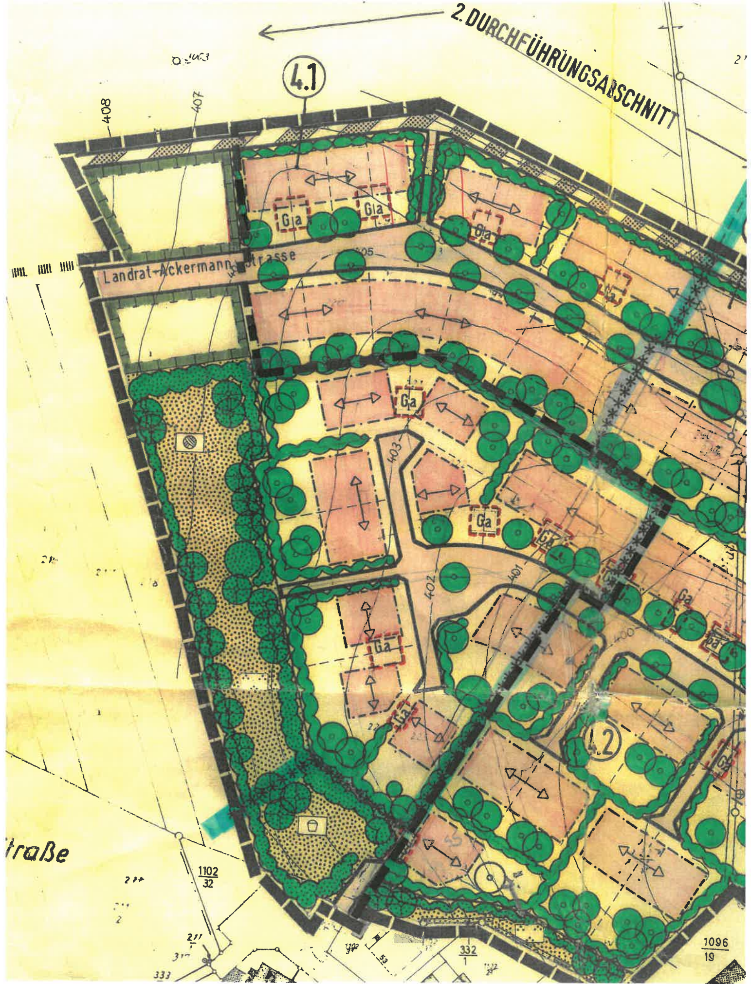
DERZEIT GELTENDER BEBAUUNGSPLAN IM BEREICH DER GEPLANTEN ÄNDERUNG