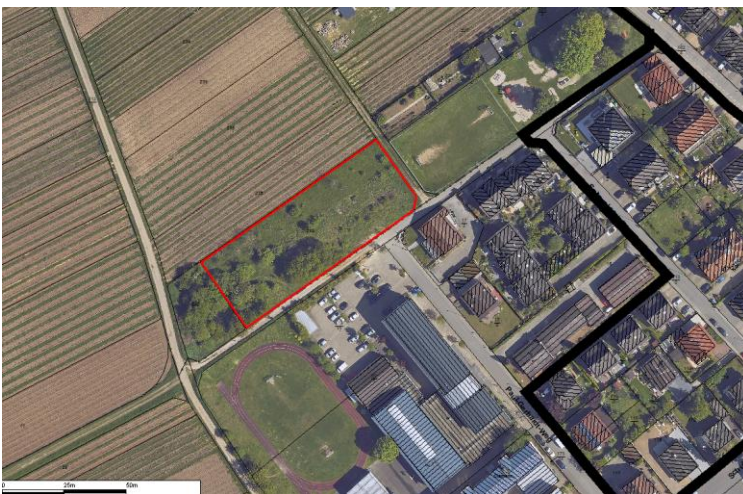
DOP 2017 mit markiertem Geltungsbereich des geplanten Bebauungsplans.