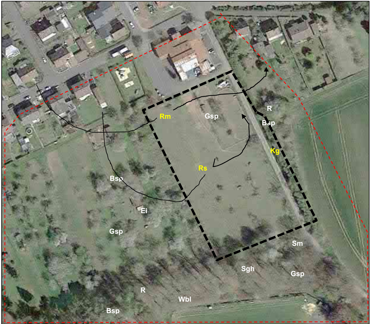
Abbildung 4: Nachweis der Nahrungsgäste im Untersuchungsgebiet (Geltungsbereich des BPL – schwarz; Untersuchungsgebiet Vögel – rot) (schwarz: Art in günstigem Erhaltungszustand (EHZ), gelb: unzureichender EHZ, rot: schlechter EHZ)

Während auch die randlich des Geltungsbereiches brütenden Vogelarten das Plangebiet zur Nahrungssuche nutzen, konnten Rotmilan, Rauchschwalbe, Bunt- und Grünspecht; Sommergoldhähnchen, Eichelhäher, Rabenkrähe, Waldbaumläufer, und Sumpfmeise als reine Nahrungsgäste im Untersuchungsgebiet festgestellt werden.