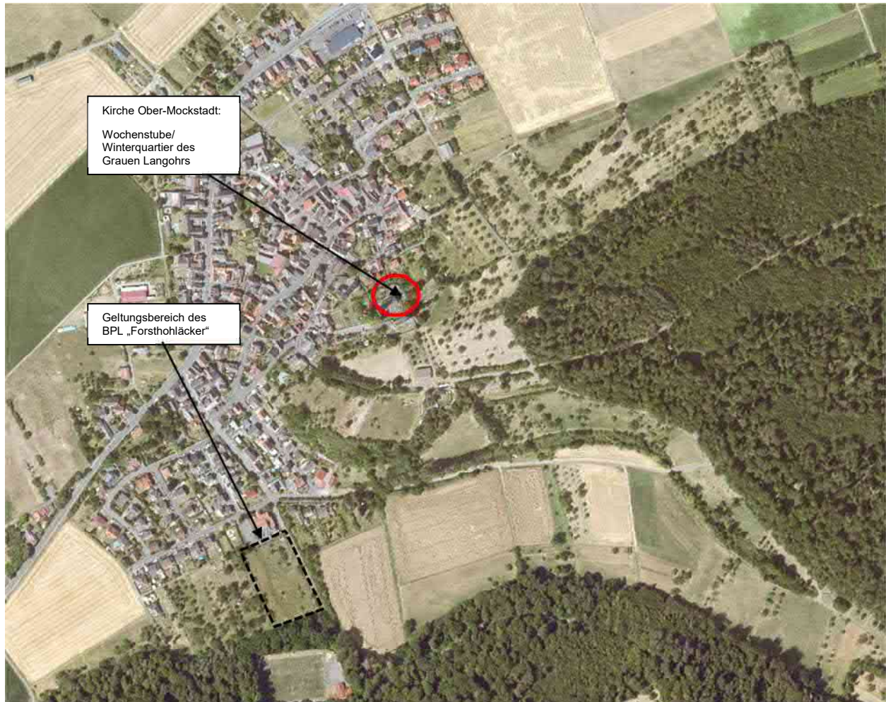
Abbildung 1: Graues Langohr Vorkommen und Geltungsbereich des BPL