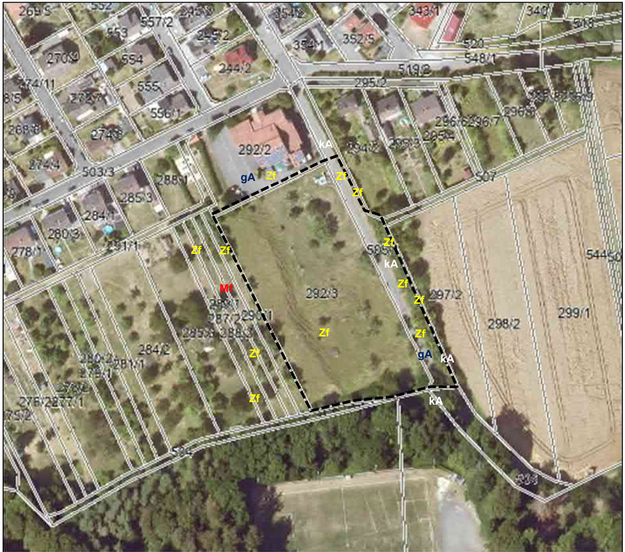
Abbildung 2: Nachweise der Fledermäuse im Plangebiet