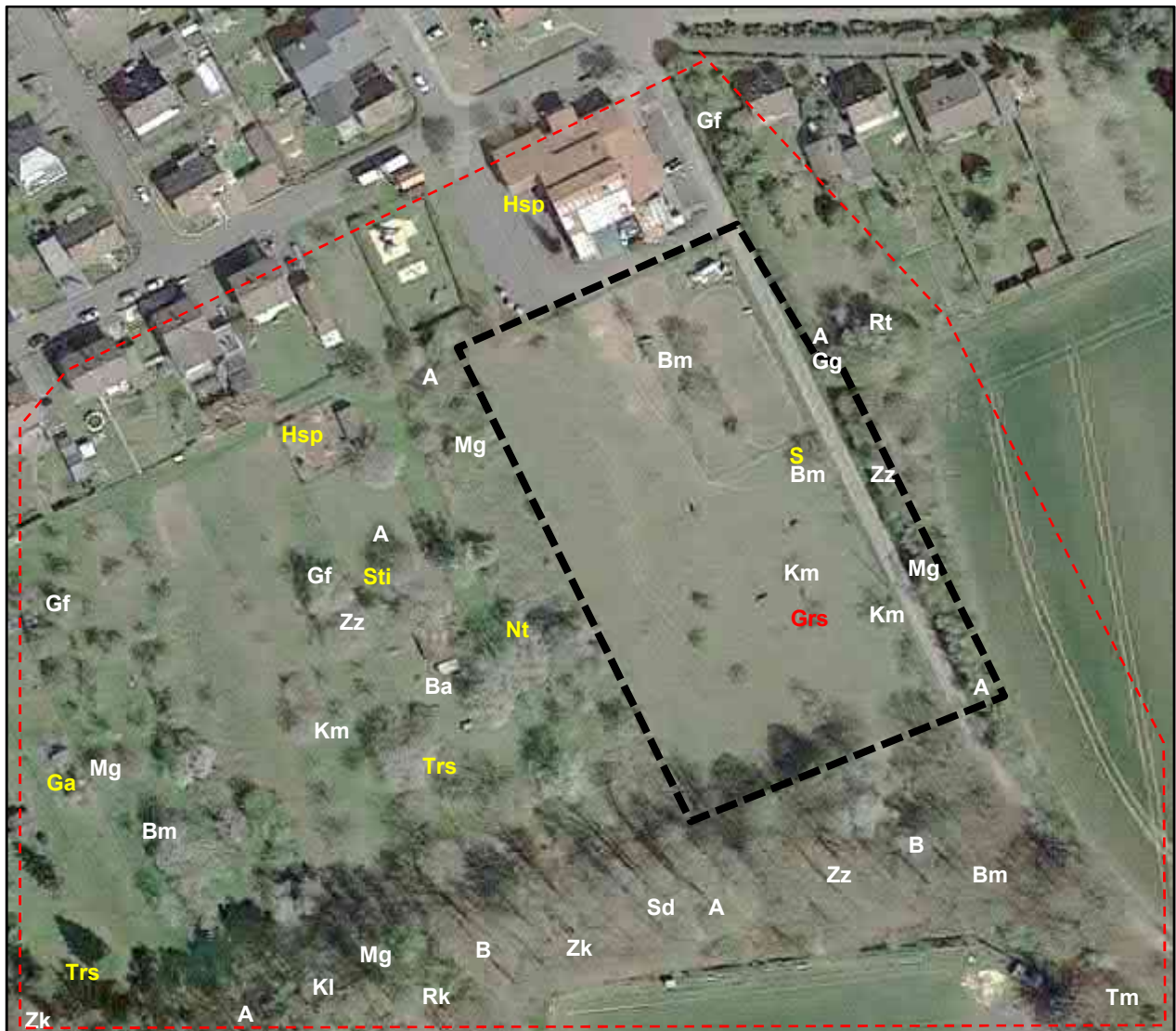
Abbildung 3: Nachweis der Brutvögel im Plangebiet (Geltungsbereich des BPL – schwarz; Untersuchungsgebiet Vögel – rot) (schwarz: Art in günstigem Erhaltungszustand (EHZ), gelb: unzureichender EHZ, rot: schlechter EHZ)

Die weiteren nachgewiesenen Brutvogelarten in einem unzureichenden Erhaltungszustand konnten v.a. im westlich angrenzenden Streuobstbereich nachgewiesen werden. Es handelt sich hierbei um Stieglitz, Neuntöter, Goldammer sowie Trauerschnäpper. Der sich ebenfalls in einem unzureichenden Erhaltungszustand befindliche Haussperling wurde v.a. im Bereich des Siedlungsrandes aufgenommen.