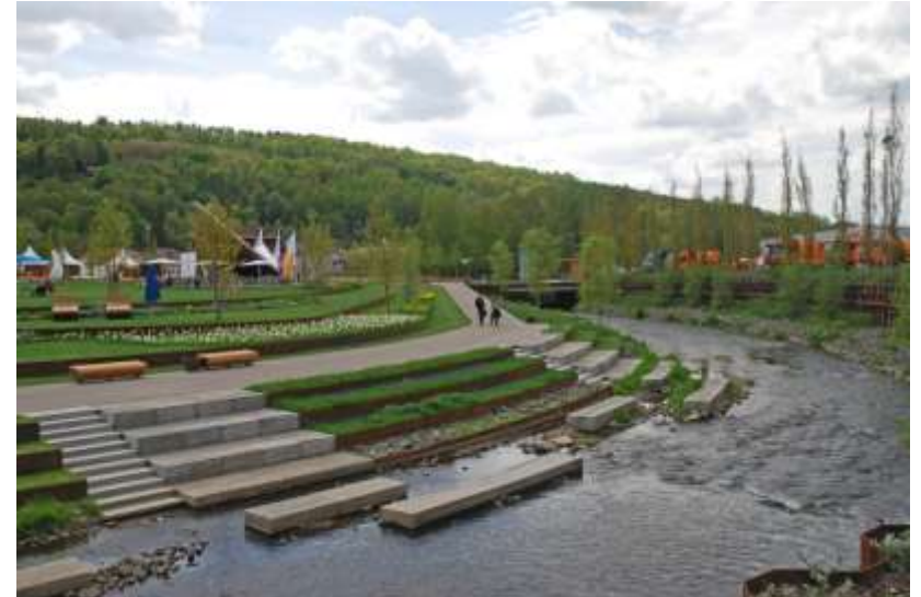
Renaturierung eines Flußabschnittes