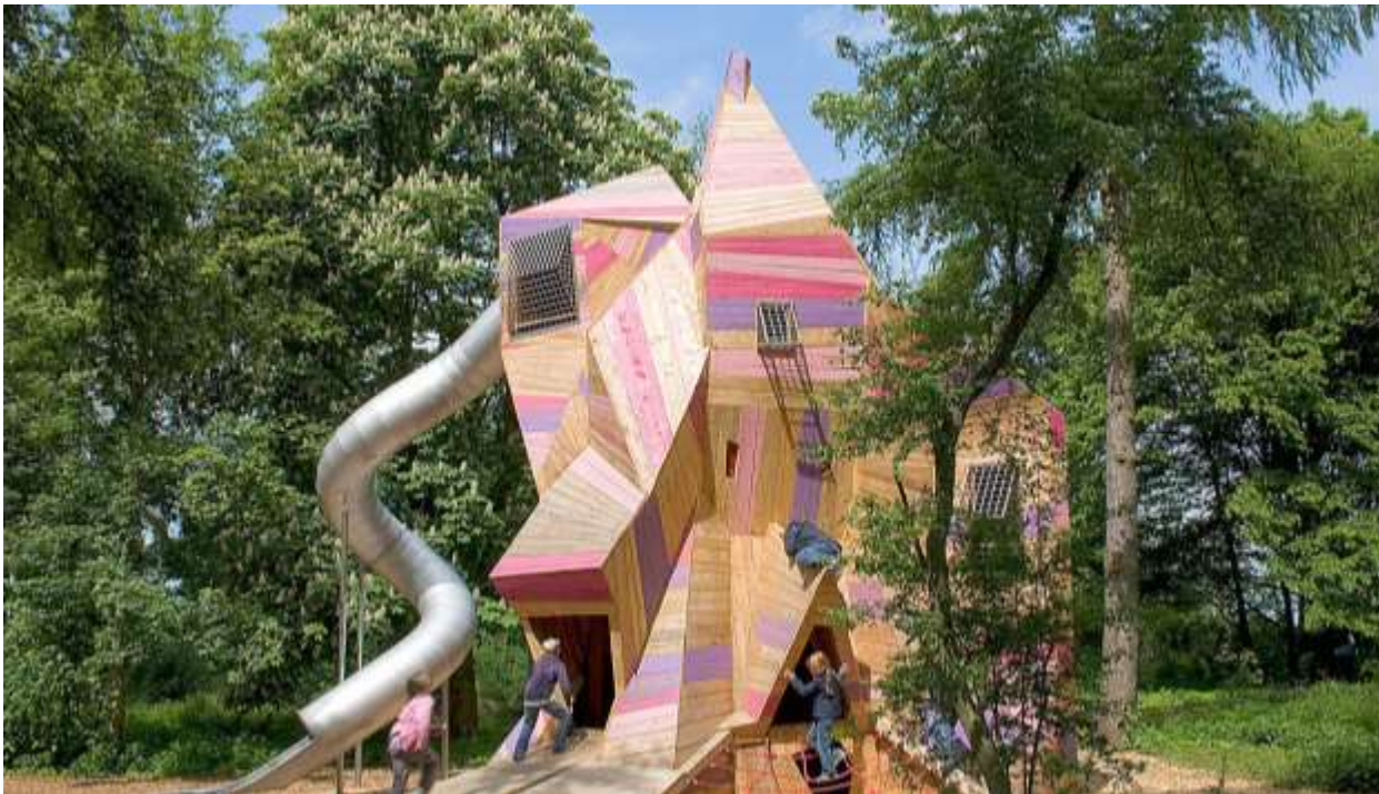
Neuanlage von Spiel- und Freizeitflächen