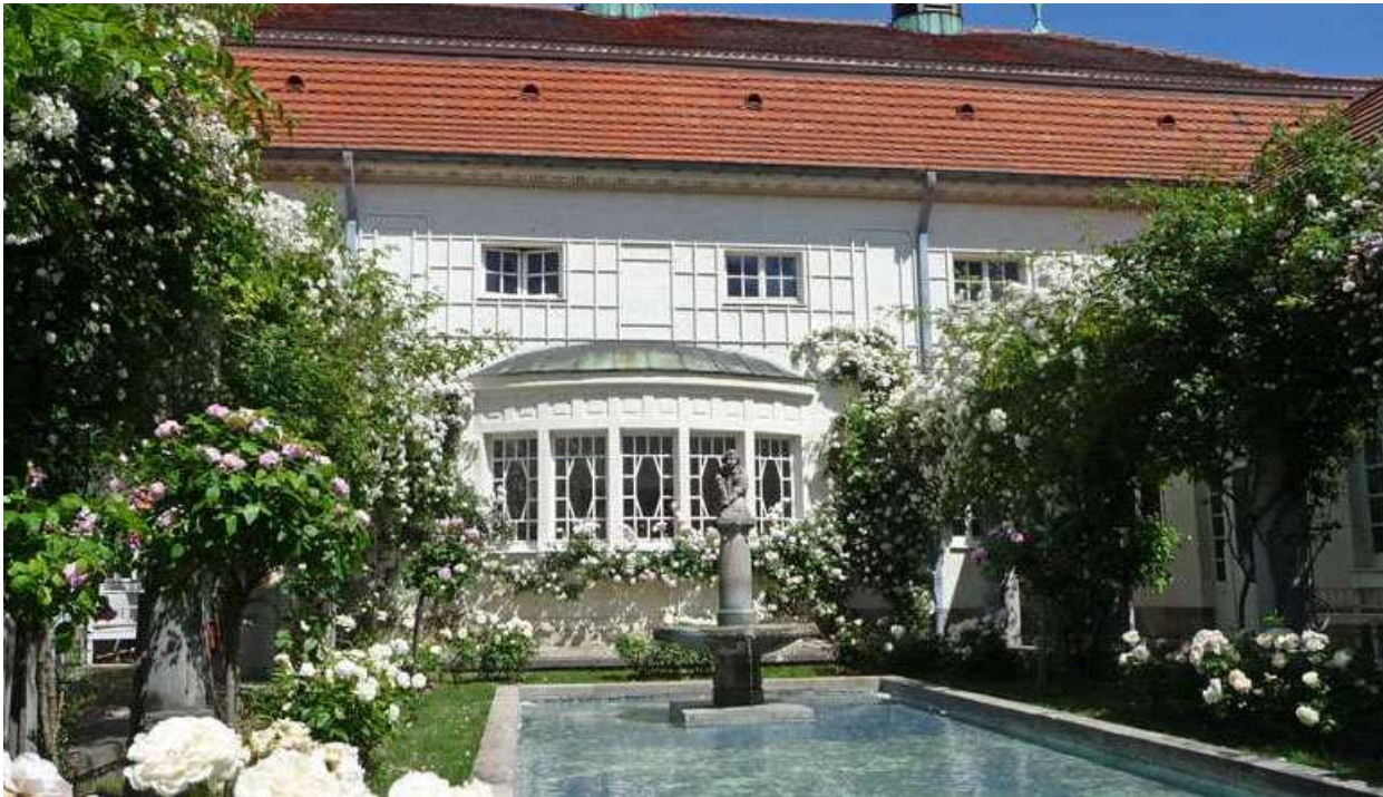
Rosengarten im Sprudelhof

Sanierung der denkmalgeschützten Kurparkanlagen