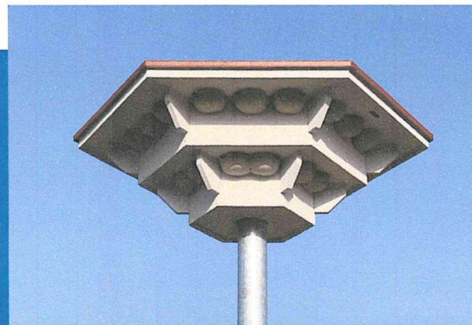
Grundmaße 2,00 x 2,00 x 1,25 m verzinkte Rohrsäule als Kippmast mit U-Profilen, Gesamthöhe ca. 5,50 m