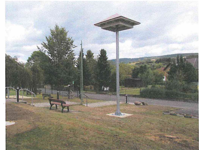
Grundmaße ca. 2,05 x 2,05 x 0,65 m, verzinkter Mast mit Fuß, Gesamthöhe ca. 6,50 m