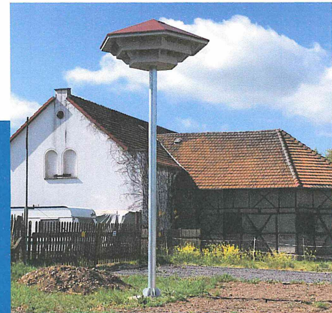
Grundmaße ca. 2,45 x 2,45 x 1,25 m, verzinkter Mast mit Fuß, Gesamthöhe ca. 6,50 m