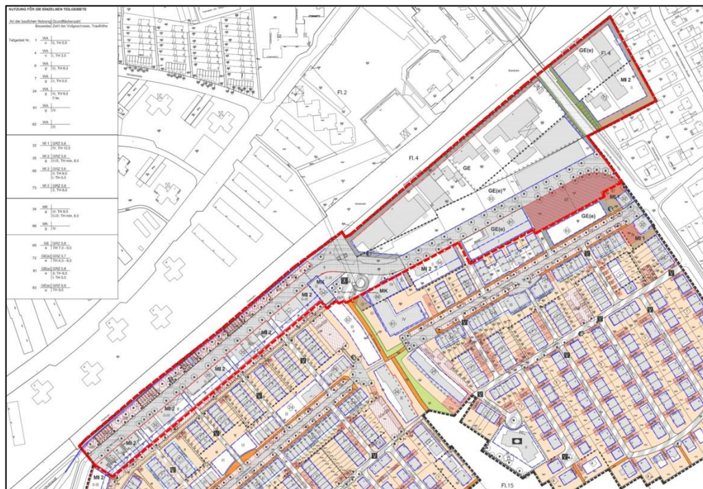
Abb.: Auszug aus der Planzeichnung des rechtskräftigen Bebauungsplans (6. Änderung) mit dem Geltungsbereich der 10. Änderung (rot umrandet)

Zur Sicherung und Entwicklung der städtebaulichen Ordnung als auch zur Vermeidung städtebaulicher Fehlentwicklungen ist der derzeit rechtsverbindliche Bebauungsplan zu ändern.