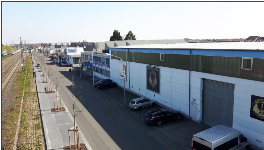
Abb.: Bereich Robert-Koch-Straße mit gewerblicher Nutzung

Das Plangebiet der 10. Änderung umfasst bereits bebaute Grundstücke an der Robert-Koch-Straße und der Straße "An der Lache" auf der Südostseite der Bahnlinie Mainz-Frankfurt. Es handelt sich dabei im Nordosten des Plangebiets um ein islamisches Gemeindehaus sowie um gewerblich genutzte Liegenschaften mit z.T. großmaßstäblicher Bebauung wie große Hallen, die durch Büro-, Wohn- und Nebengebäude ergänzt werden. Auch ein größerer Einzelhandelsbetrieb befindet sich innerhalb des Geltungsbereichs.