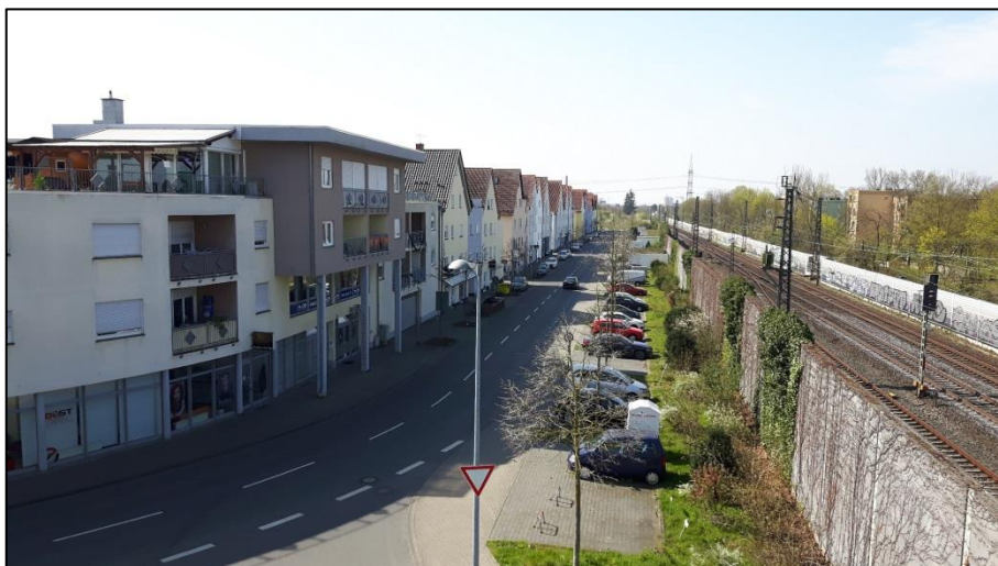
Abb.: Bereich An der Lache mit gemischter Nutzung

Im Südwesten, in dem Bereich, wo die Straße "An der Lache" zur Bahnlinie hin verschwenkt, schließt sich ein gemischt genutztes Gebiet mit hoher Dichte und teilweise gewerblicher Nutzung im Erdgeschoss an.