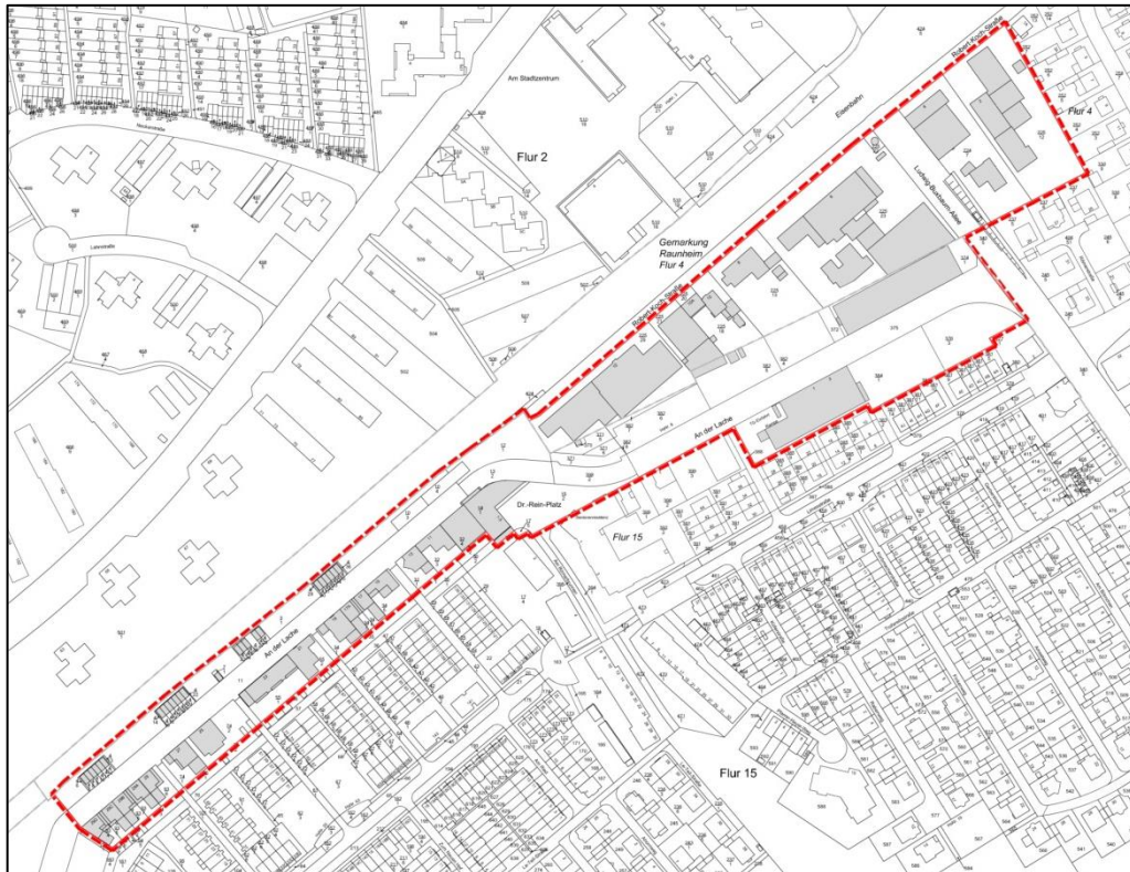
Abb.: Kataster mit Geltungsbereich (rot umrandet)

Das Plangebiet hat eine Fläche von ca. 5,4 ha und ist, bis auf die Unterführung der Ludwig-Buxbaum-Allee, topografisch eben.