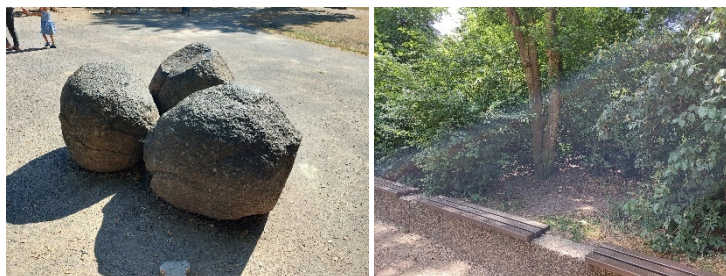
Abb. 11 und 12