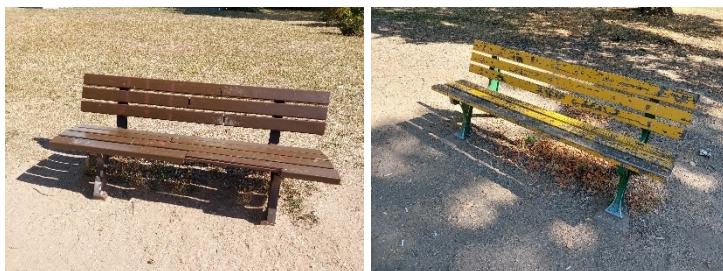
Abb. 9 und 10