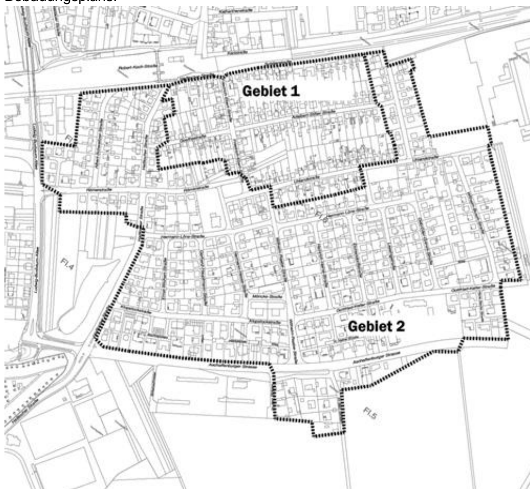
Abb. 1: Räumliche Abgrenzung des derzeitigen Geltungsbereichs

Seit Rechtskraft der Satzung hat das Quartier bauliche Erweiterungen erfahren. Die Entwicklung des Bereichs „Südlich der Bahn“ ist hinsichtlich der Art und des Maßes seiner baulichen Nutzung nach über den Bebauungsplan geregelt. Hinsichtlich der gestalterischen Festlegungen bedarf es nunmehr der Anpassung des Geltungsbereichs der Gestaltungssatzung an den des Bebauungsplans.