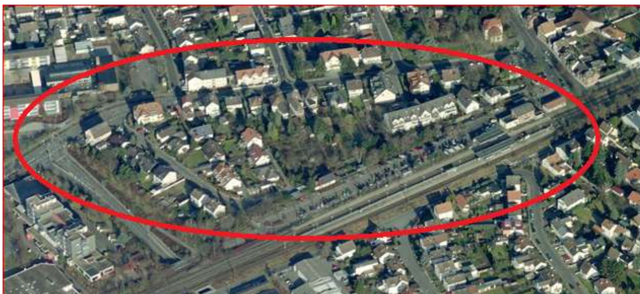
Abb. 1: Räumliche Bestandssituation

Hintergrund für die Aufstellung eines Bebauungsplans sind umfangreiche bauliche Nachverdichtungsabsichten in einem ökologisch hochwertigen Grünbereich.