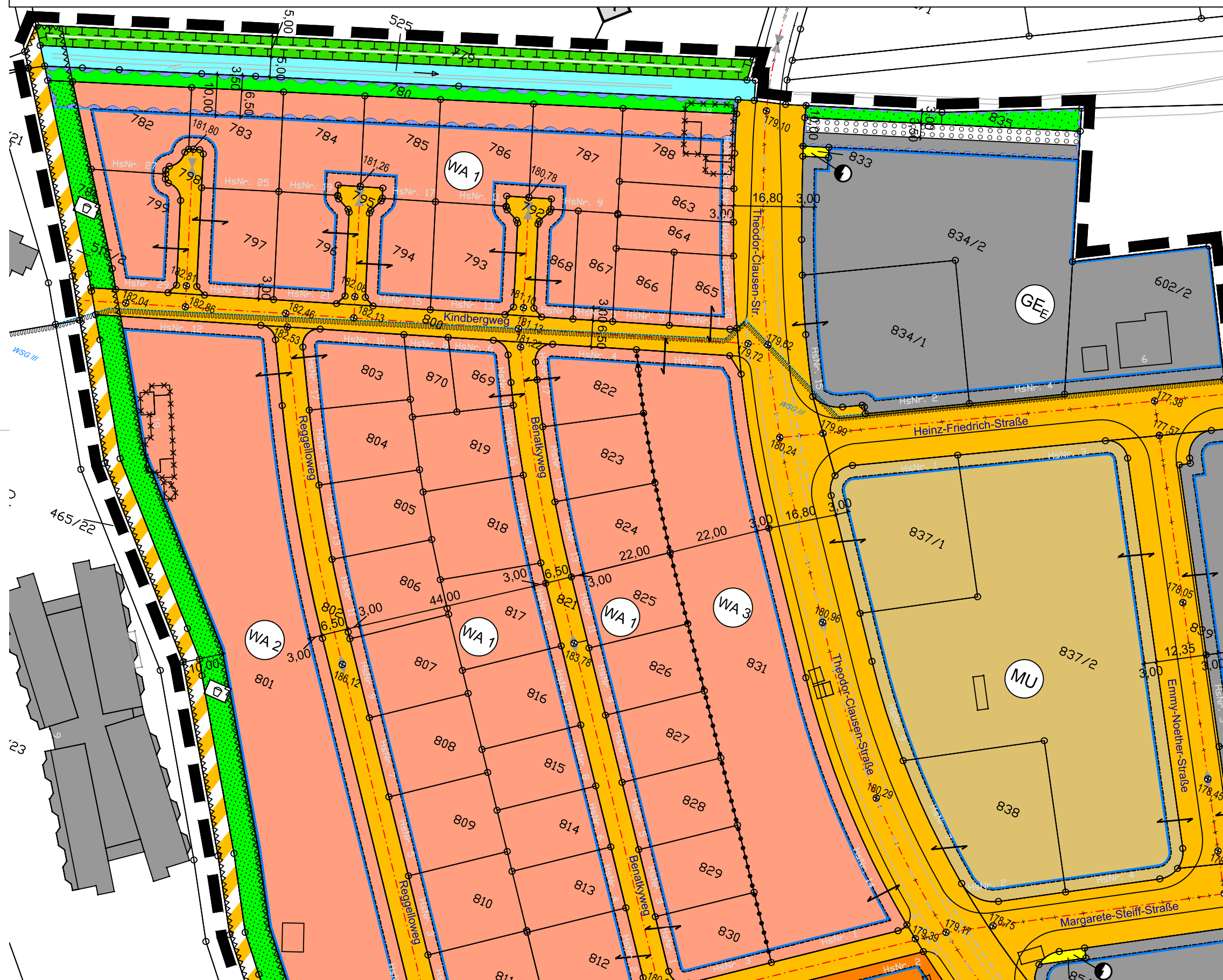
PLANZEICHNUNG - Detailplan 2