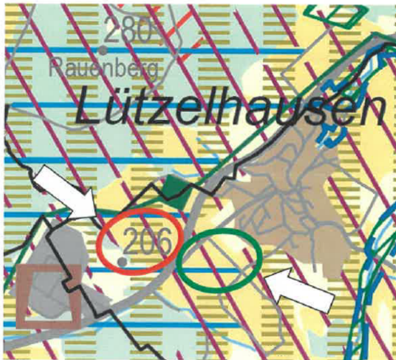
Abbildung 10: Ausschnitt RPS 2010 mit Kompensationsfläche Regionaler Grünzug