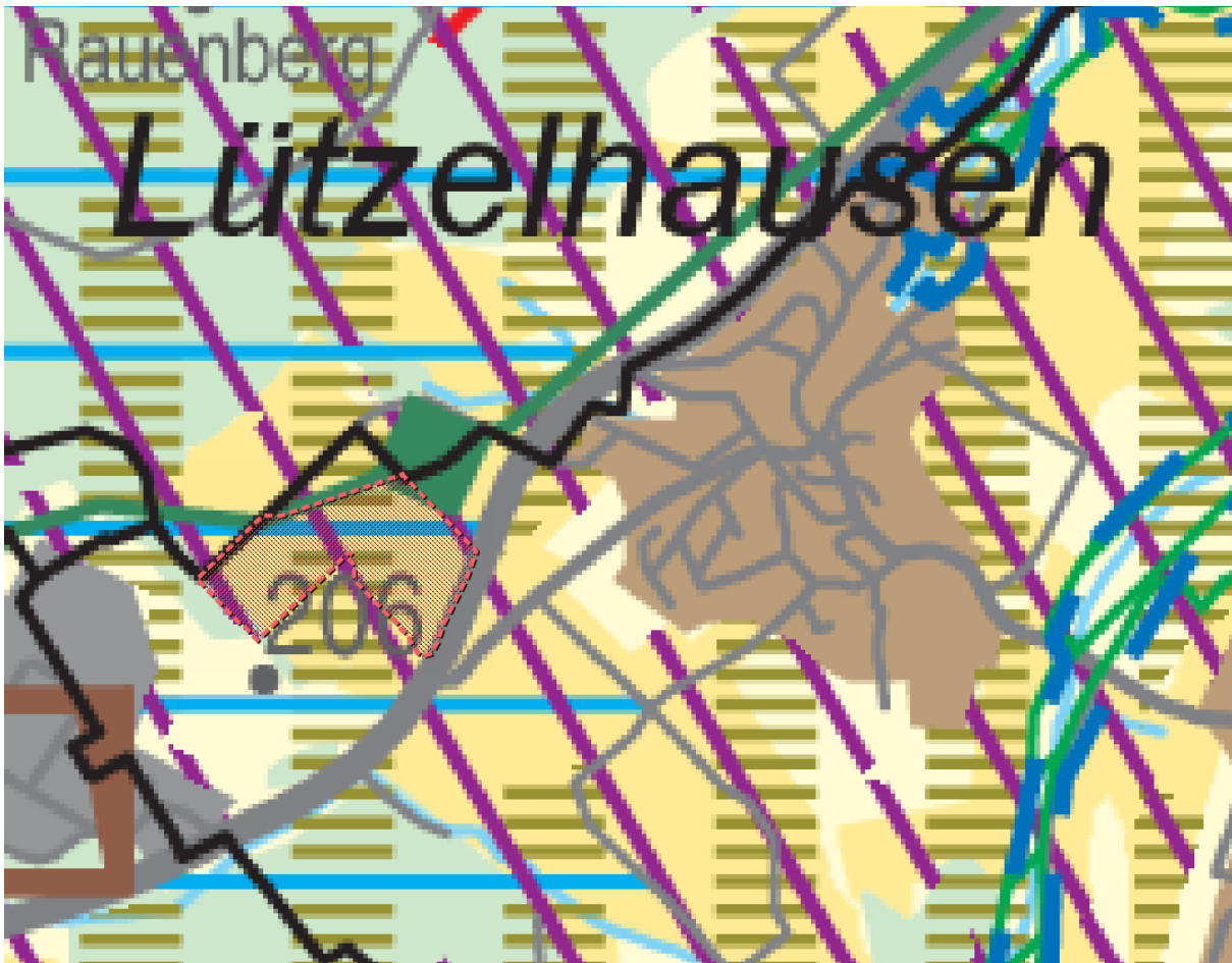
Fläche, für welche die Abweichung zugelassen werden kann