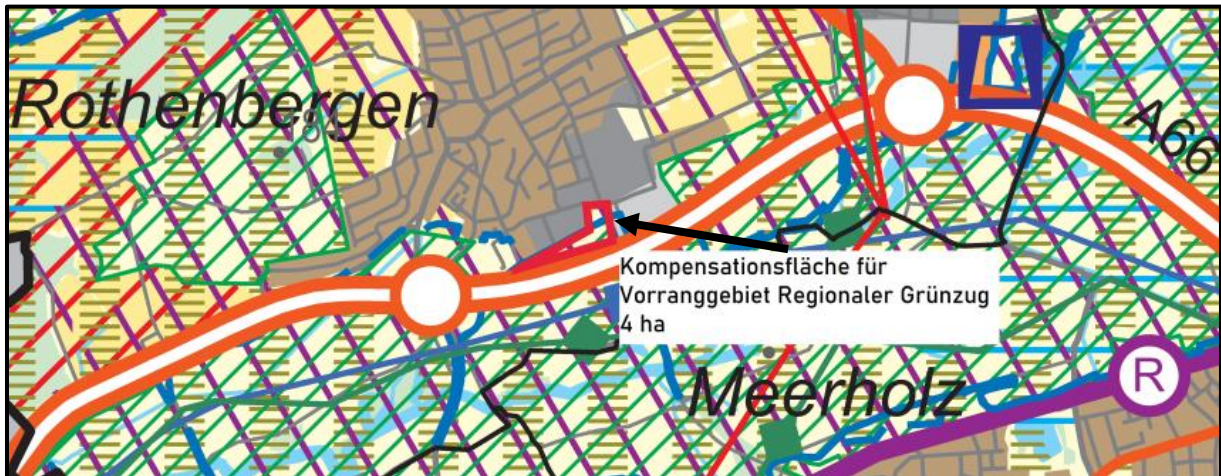
Kompensationsfläche des VRG Reg. Grünzug in Gründau Rothenbergen nördlich A 66 im LSG Auenverbund Kinzig