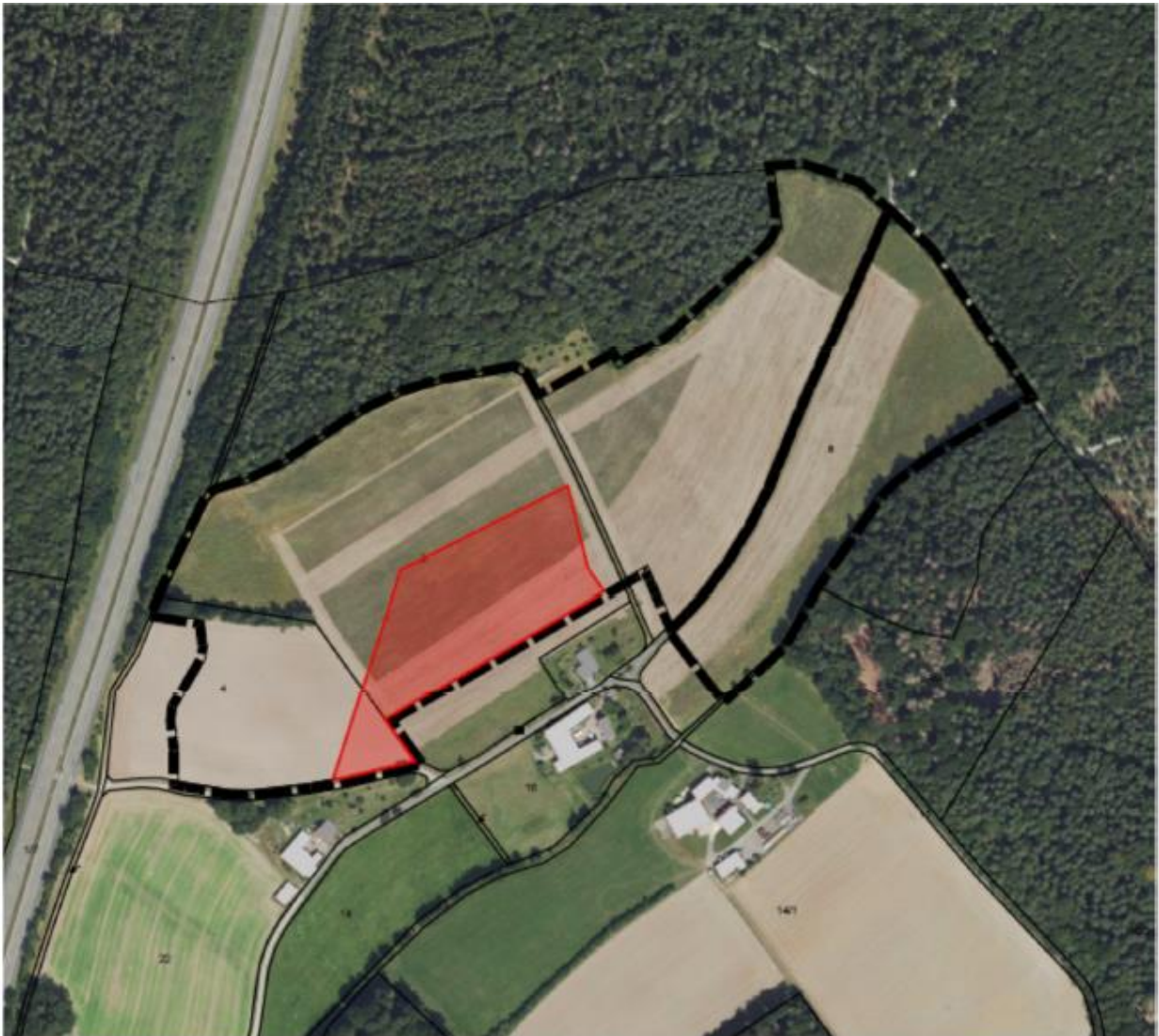
Luftbild mit Lage des Bauleitplangebiets und Zielabweichungsbereich in rot unterlegt