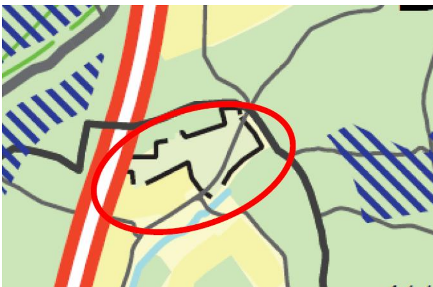
Zur Ergänzung: Auszug aus dem Teilregionalplan Energie für den Planbereich