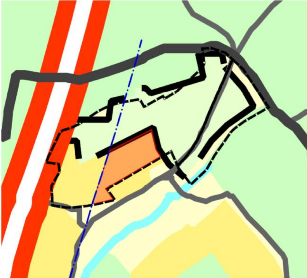
Ausschnitt RPN 2009 mit Lage des Bauleitplangebiets und Zielabweichungsbereich in rot/orange unterlegt, die blaue gestrichelte Linie zeigt dem 200m Abstand zu Autobahn (Privilegierungstatbestand)