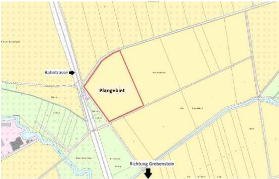
Anlage 2: Geltungsbereich der Antragsfläche – Lageplan (ohne Maßstab)