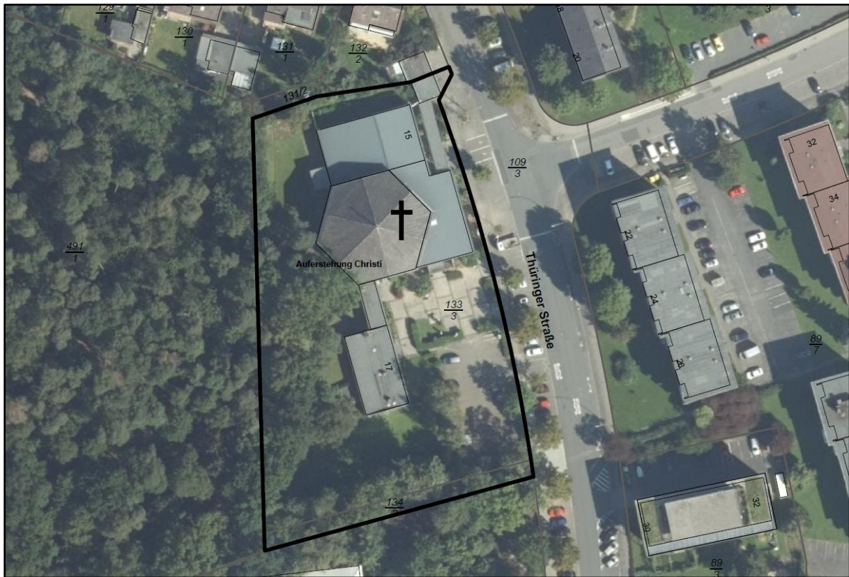
Abbildung 3: Luftbild Bestand