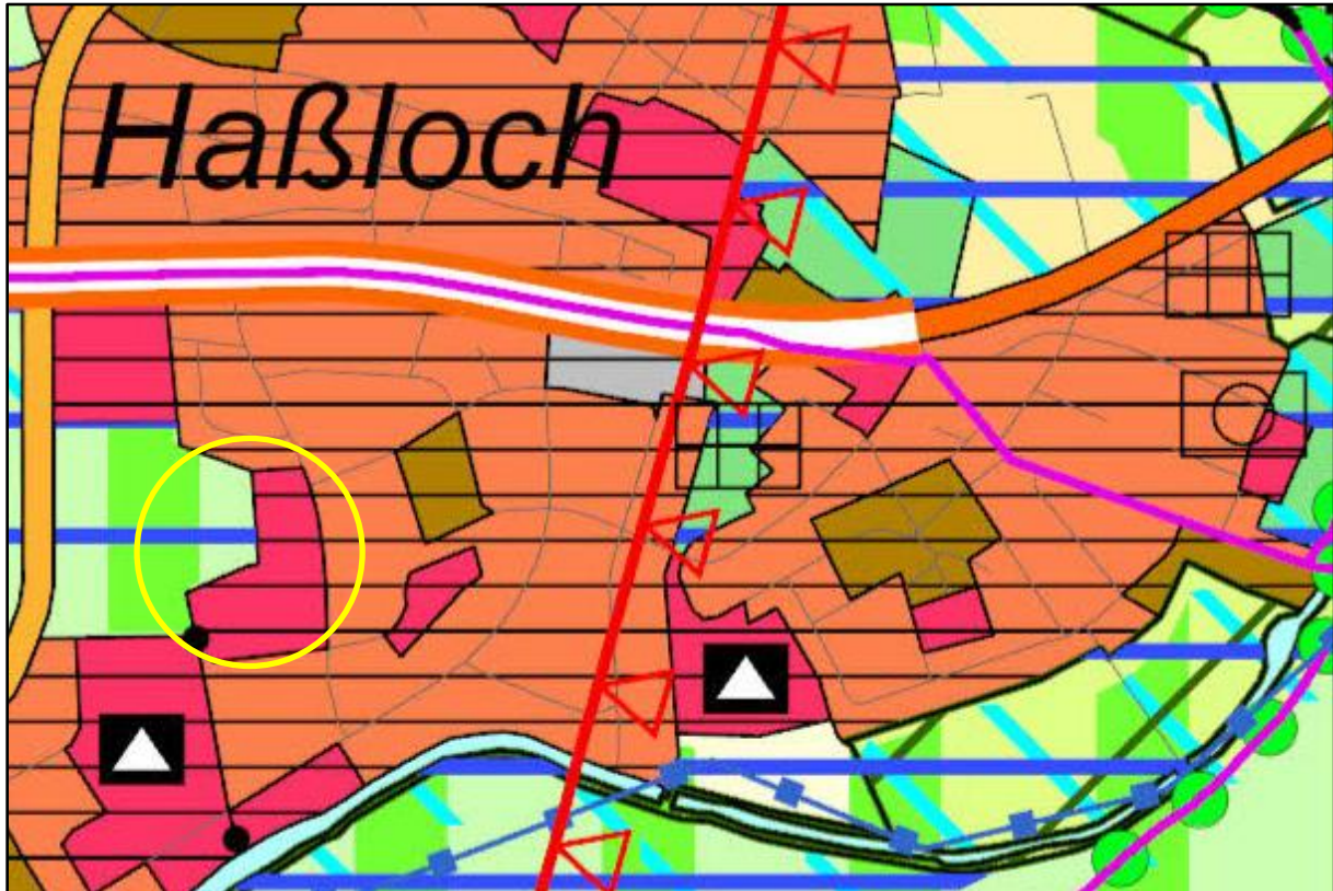
Abbildung 1: Ausschnitt aus dem rechtsgültigen regionalen Flächennutzungsplan (2010)

Das Plangebiet liegt innerhalb des seit Oktober 2011 gültigen regionalen Flächennutzungsplans 2010. Dieser beinhaltet den Regionalplan Südhessen und den regionalen Flächennutzungsplan 2010 und wurde vom Regionalverband Frankfurt Rhein Main erarbeitet. In der zugehörigen Kartierung ist der Geltungsbereich des Änderungsverfahrens als „Gemeinbedarfsfläche im Bestand“ dargestellt.