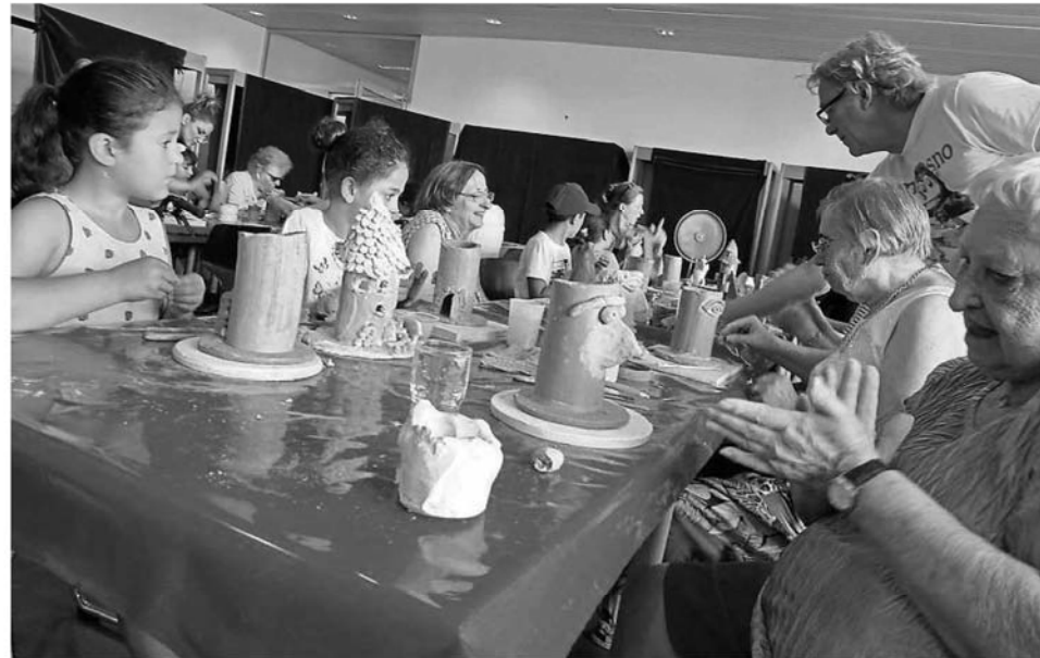
Ihren Spaß hatten Senioren und Kinder beim gemeinsamen Töpfeln.

Um es für die überwiegend ungeübten Teilnehmer nicht ganz so schwer zu machen, hatte der frühere Betreiber einer Bauschlosserei, der sein Gewerbe mit Mitte 50 an den Nagel hängte, um sich der Töpferei zu widmen, vorbereitete Tonröhren mitgebracht. „Damit kann schnell ein vorzeigbares Ergebnis erzielt werden“, sagt Schymonski, der in seiner Heimatstadt auch Kurse anbietet.