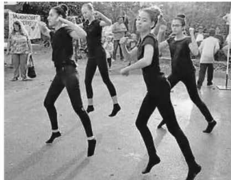
Die Tanzgruppe „Dragonhearts“ der TuS begeistert die Besucher mit ihrer gut choreografierten Darbietung.

Auf der kleinen Freifläche neben dem Speedkicker bieten die Flötengruppe der Schillerschulen und die Tanzgruppe „Dragonhearts“ der TuS Rüsselsheim tolle Auftritte vor einem begeisterten Publikum. Das Trio „!Duende Now!“ sorgt mit internationalen Klängen zeitweise für eine besondere musikalische Untermauerung auf dem Platz.