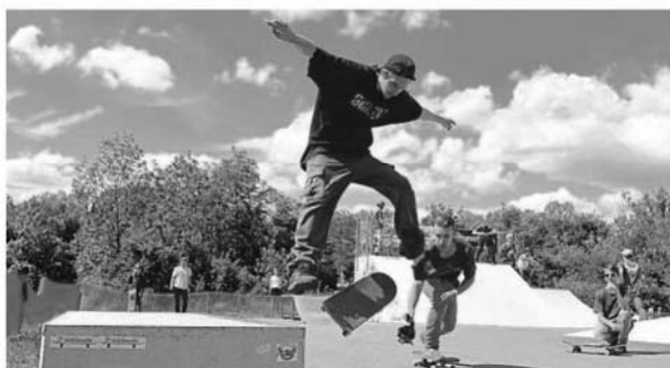
In der Luft: Skater zeigen gewagte Sprünge.

Für besonderen Spaß sorgten die sogenannten „Fun Quests“,