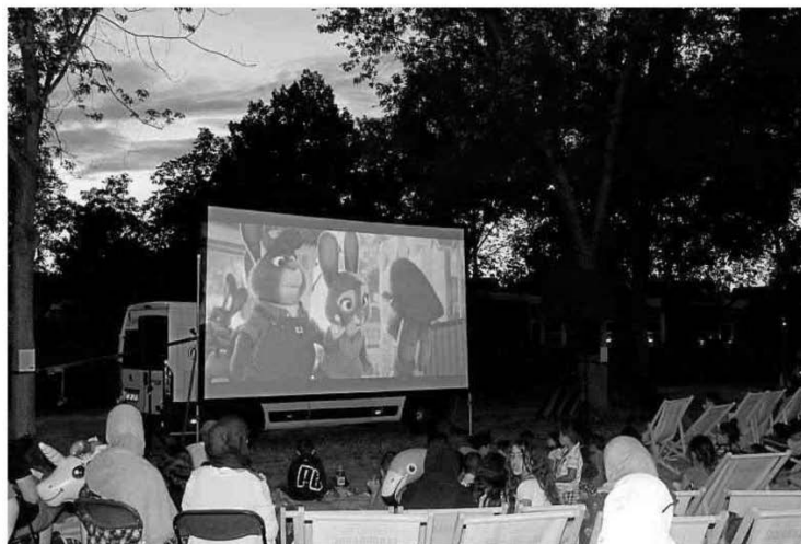
Auf Liegestühlen und mit Schwimmreifen aus Gummi genießen die Besucher des Freiluft-Kinos im Berliner Viertel den Oscar-prämierten Disney-Film „Zoomania“.

„Solche Veranstaltungen sollte man unterstützen“, sagt Besucherin Sandra. Ihre Tochter Lorin sei schon ganz gespannt, da