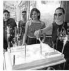
Süße Geburtstagsstorte im Jugendtreff Berliner Viertel.

Los ging es im Berliner Viertel, als es 2006 Beschwerden zu Lärm und Vandalismus von Jugendlichen kam. „Auszeit“ nahm als mobiles Angebot, ab 2009 dann im neuen Jugendtreff die Arbeit auf. „Die Stadt hatte für den Ausbau der Räume richtig viel Geld in die Hand genommen“, lobt Kelm. Engagement und pädagogisches Können bewähren sich seitdem jeden Tag aufs Neue.