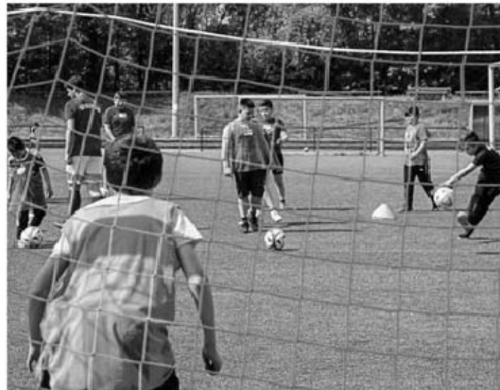
Fußballerfahrung haben nur wenige Teilnehmer des Fußballcamps.