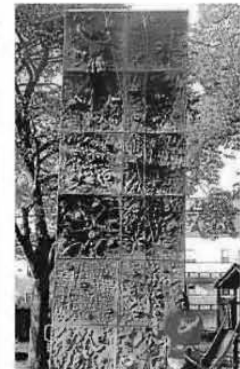
Hoch hinaus geht es an der Kletterwand.