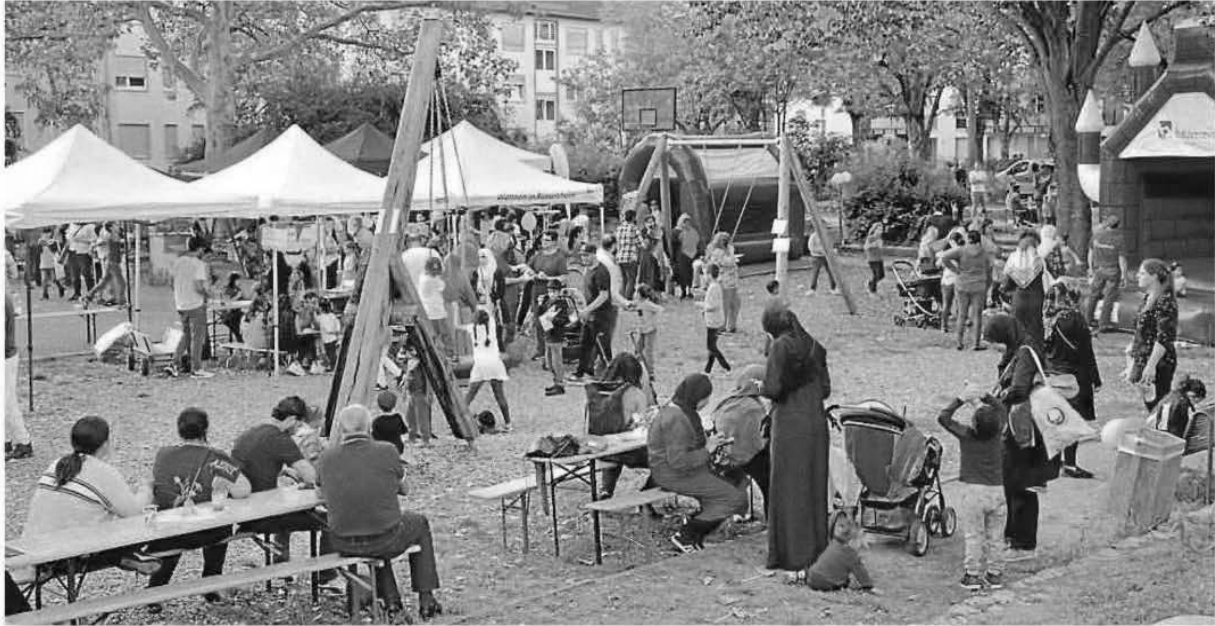
Bei bestem Wetter feiern mehr als 300 Gäste am Freitag das Nachbarschaftsfest auf dem Böllerseepplatz.