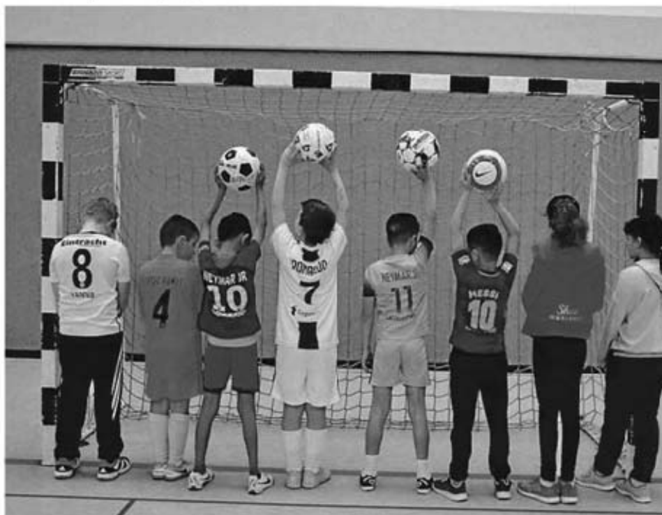
Kleine Messis, Ronaldos und Neymars kicken beim Osterferienturnier.

Das Fußballturnier ist ein Gemeinschaftsprojekt von Auszeit und Streetwork der Stadt. Beide Einrichtungen bildeten dabei ein Fachteam, berichtet Ramona Schwitter von Streetwork. „Wir haben bei den Kindern Werbung für das Turnier gemacht. Es gibt aber auch viele, die schon einmal dabei waren und uns seit Wochen fragen, wann das Osterturnier endlich