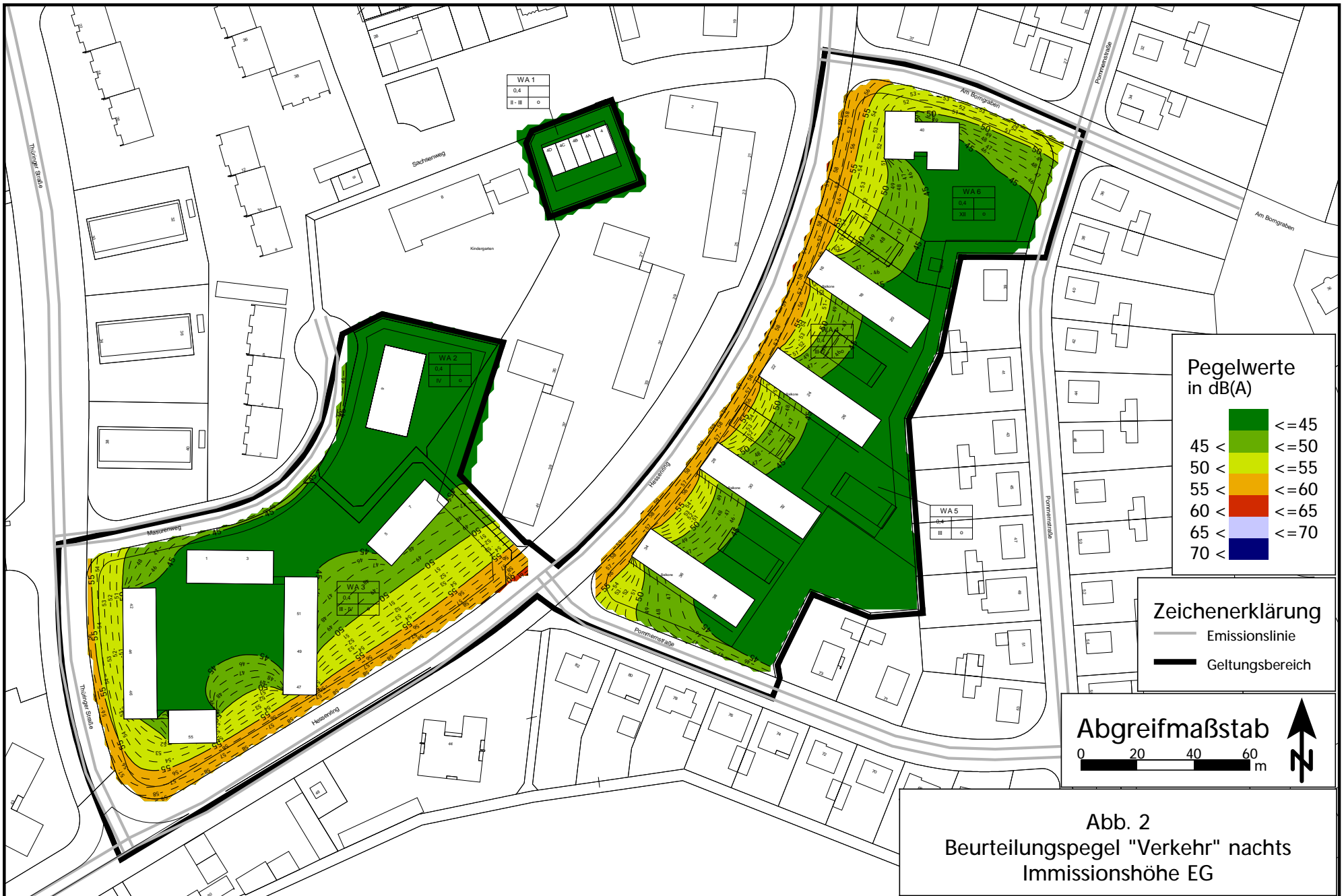
Abb. 2 Beurteilungspegel "Verkehr" nachts Immissionshöhe EG