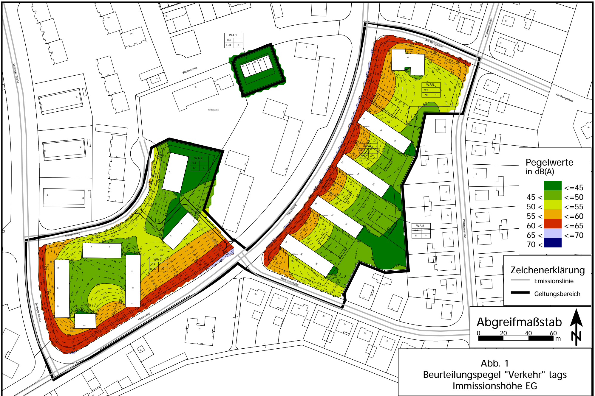
Abb. 1 Beurteilungspegel "Verkehr" tags Immissionshöhe EG