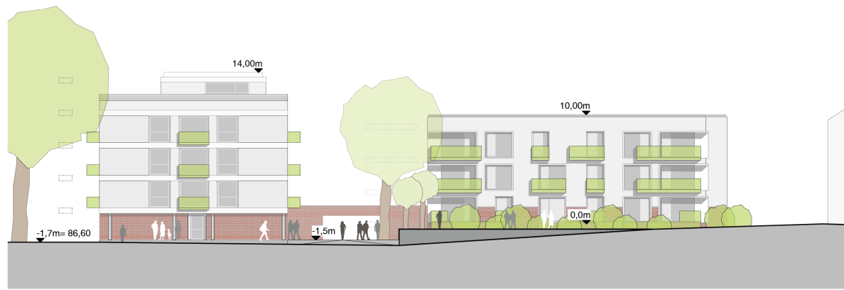
Ansicht Süd Wohnhaus und Studentenwohnheim