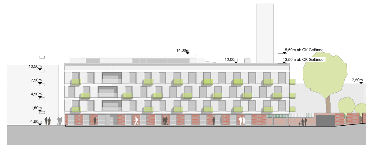
Ansicht West Studentenwohnheim

Nachrichtliche Übernahme der Planung / Darstellung pätzold kremer architekten, Stand 26.03.2018 Die Ausgestaltung der Gebäudefassaden stellt einen nicht verbindlichen Arbeitsstand der Planung dar.