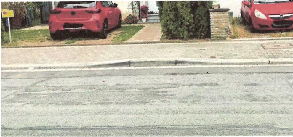
Berg- und Talbahn in der Feuerbachstraße