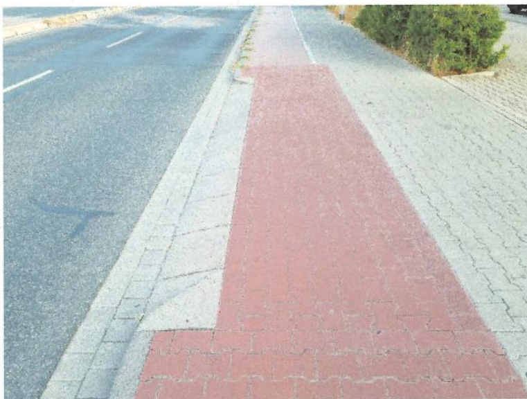
Schrägbord in der Adam-Opel-Straße, Höhe Sparkassenfiliale: Kein Auf und Ab auf dem getrennten Geh- und Radweg

Abgesenkte Bordsteine vor Grundstücken sollen die Zufahrt mit einem Kraftfahrzeug ohne Beschädigung sicherstellen. Dies steht jedoch in Konflikt mit dem Fußverkehr und bei einer Radwegführung nicht auf der Fahrbahn auch mit dem Radverkehr. Dass dieser Konflikt nicht notwendig ist, zeigt das Beispiel der Sparkassenfiliale in der Adam-Opel-Straße. Dort ist der getrennte Geh- und Radweg durchgängig auf demselben Niveau und Kfz mit dem Ziel des Sparkassenparkplatzes können diesen dennoch ohne Schäden am Fahrzeug erreichen.