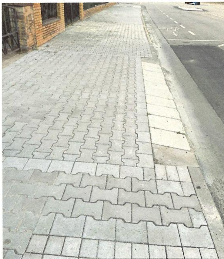
Gute Lösung auf dem Gehweg in der Lucas-Cranach-Straße