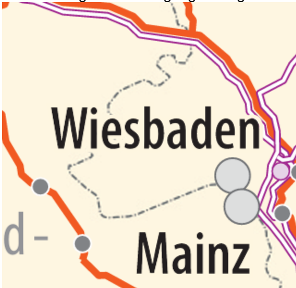
(Auszug Karte Höchstspannungsleitungen)

Die Gemeinde Schlangenbad ist nicht von Höchstspannungsleitungen betroffen, daher werden keine Belange oder Anregungen vorgebracht.