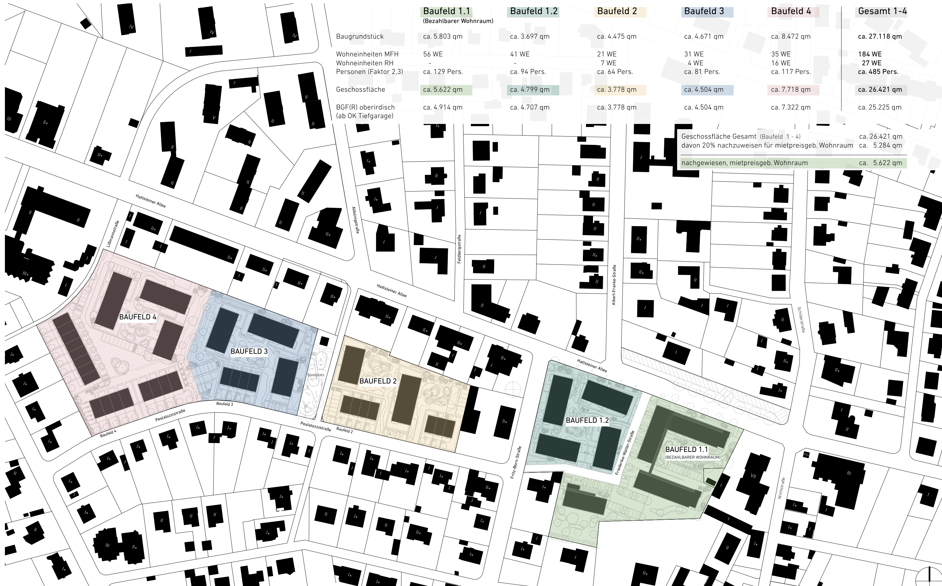
BAUFELD 1-4 - ÜBERSICHTSPLAN - GESCHOSSFLÄCHENBERECHNUNG