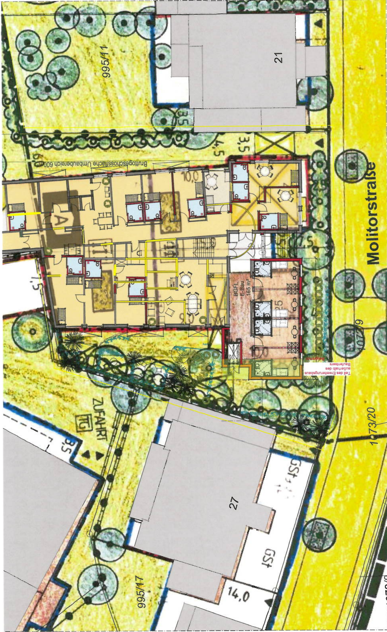
Viernheimer Forum der Senioren Machbarkeitstudie Erweiterungsbau , Ausbau 2.OG Dach und Hausgemeinschaft EG Darstellung der Umgebung zur Beurteilung der städtebaulichen Verträglichkeit; Lageplan M1:200 ABG 11. Nov. 2011