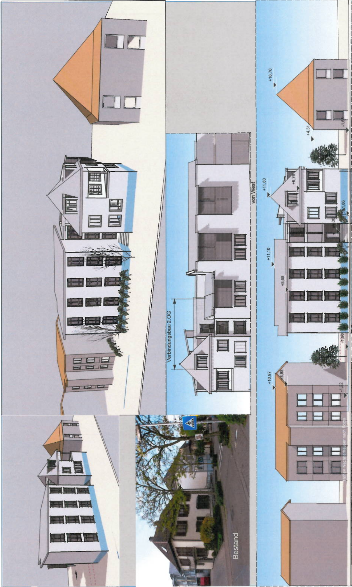
Straßenabwicklung Molitorstraße 1:250

Viernheimer Forum der Senioren Machbarkeitstudie Erweiterungsbau , Ausbau 2.OG Dach und Hausgemeinschaft EG Darstellung der Umgebung zur Beurteilung der städtebaulichen Verträglichkeit ABG 11. Nov. 2011