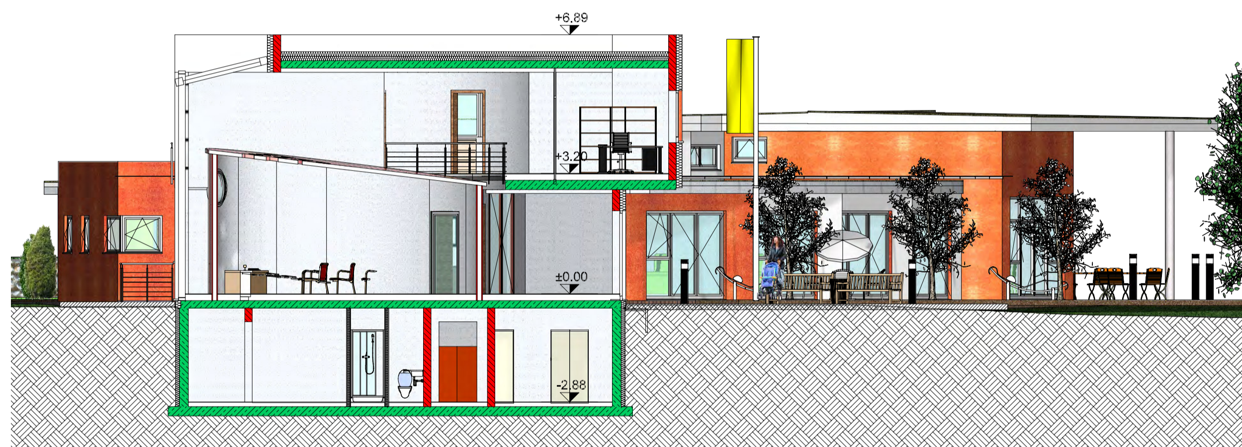
SCHNITT A - A