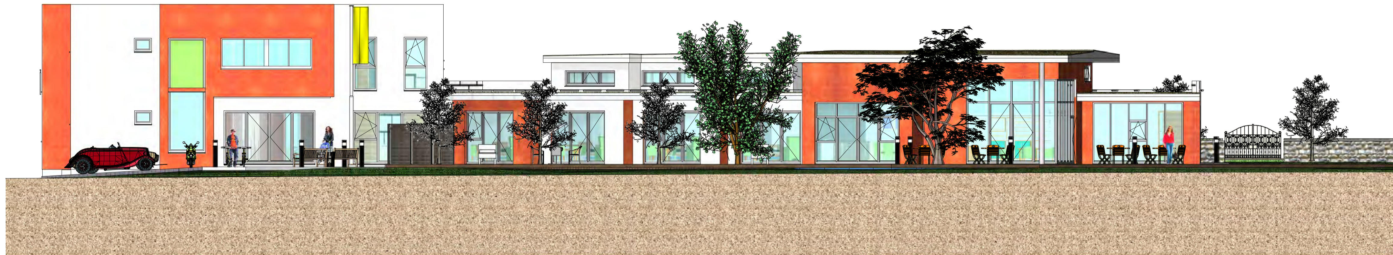
ANSICHT - HAUPT EINGANG