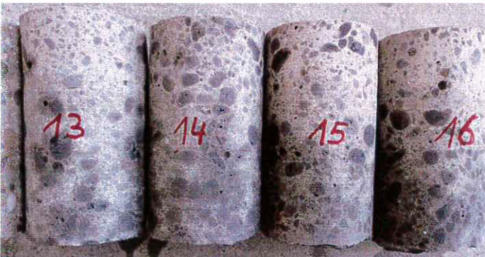
Giebelwände LB 13-16 Gleichmäßiges u. dichtes Gefüge