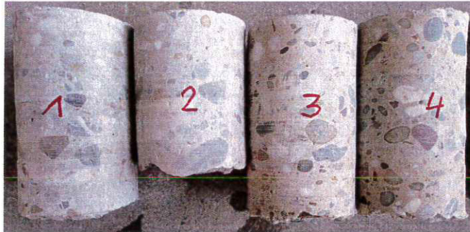
Binder 1-4 Gleichmäßiges u. dichtes Gefüge